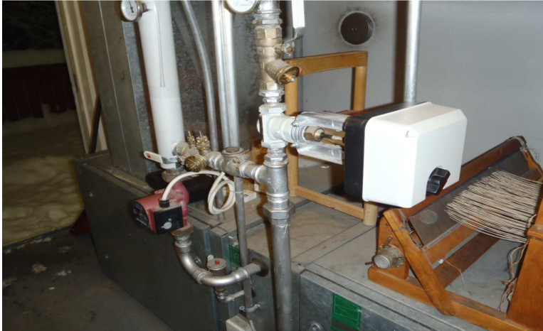
Kuva 1. Yleiskuva IV- konehuoneesta.