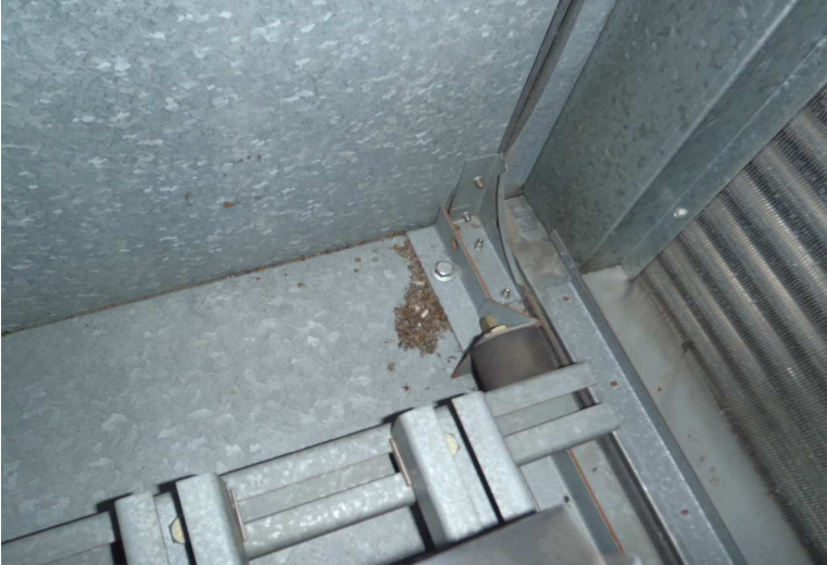
Kuva 4. Tuloilmakoneen puhallinkammiossa on hieman roskaa. Kammiot on syytä imuroida huoltojen yhteydessä.