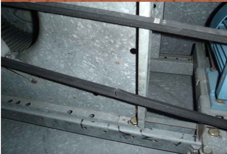
Kuva 3. Tuloilmakoneen hihna on melkein poikki. Hihna tulee uusia välittömästi.