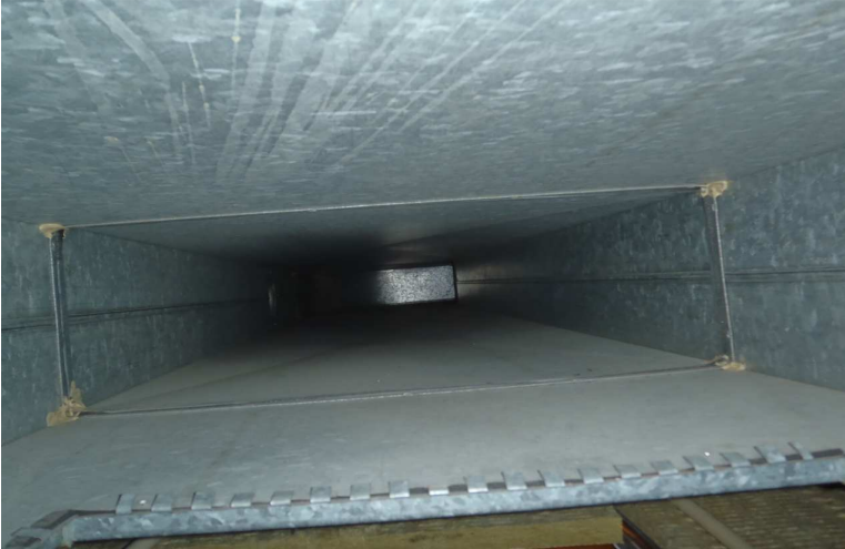
Kuva 7. Yleiskuva tuloilmakanavasta. Kanavat on puhdistettu vuonna 2010.