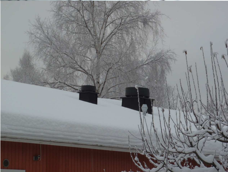
Kuva 6. Lisärakennuksen vesikatolla on keittiötä ja muita tiloja palvelevat huippuimurit. Huippuimurit ovat alkuperäisiä Fläktin valmistamia puhaltimia.