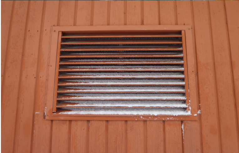
Kuva 2. Tuloilmakoneen raitisilmakammioon saattaa päästä lunta. Tuloilmasäleikön eteen tulisi harkita lumisiepparin asentamista.