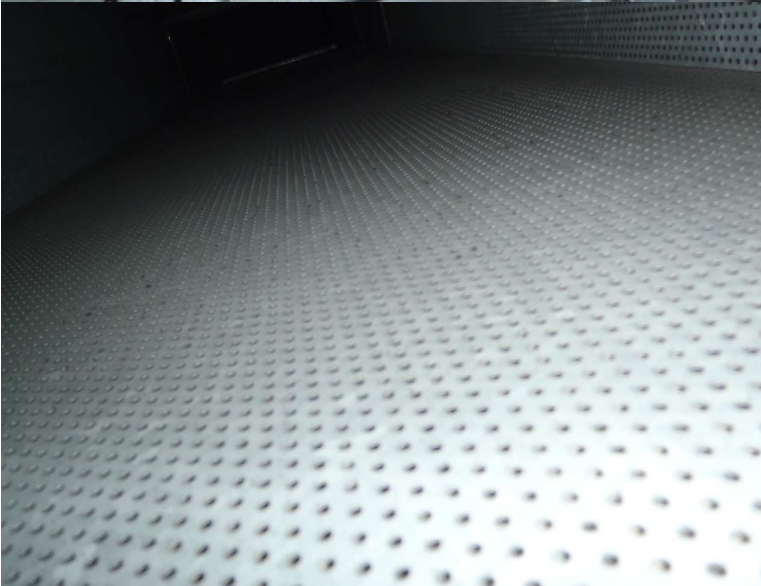
Kuva 5. Tuloilmakoneen äänenvaimennuskammio on eristetty mineraalivillalla, jonka päällä on reikäpelti. Kanavien liikkussa paineen voimasta huoneilmaan saattaa päästä mineraalivillakuituja. Kammion villapinnat tulee suojata suodatinkankaalla ja pellittää, jotta villakuitujen mahdollinen pääsy huoneilmaan saadaan estettyä. Vaihtoehtoisesti nykyiset pinnat tulee puhdistaa ja käsitellä suoja-aineella.