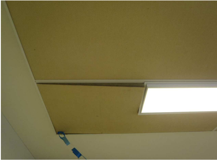
Kuva 10. Lisärakennuksen ka-toissa on akustolevyjä, jotka ovat osittain rikkoontuneet. Levyjen saumoista ja niiden rikkoutuessa huonetiloihin saattaa päästä vuorivillakuituja. Suosittelemme ka-toissa olevien akustolevyjen uusimista tai käsittelemistä suoja-aineella lähivuosien aikana.