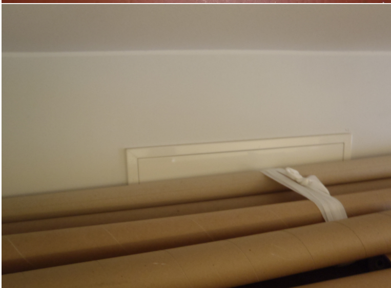
Kuva 12. Ruokailuhuoneessa on tuloilmaventtiin edessä pahvi-putkia. Henkilökuntaa tulisi oh-jeistaa, ettei ilmanvaihtoventtiilei-tä saisi tukkia.