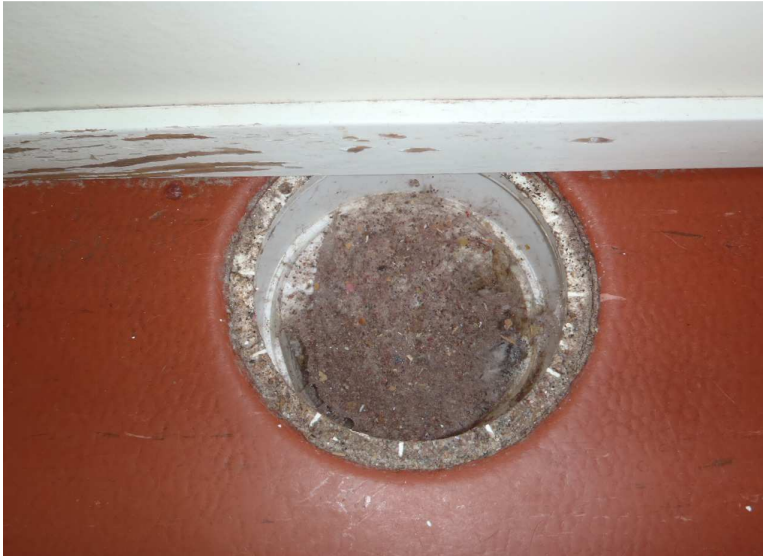
Kuva 11. Kenttäkierroksella ha-vaittiin monta lattiakaivoa, jotka olivat tyhjiä ja joista saattaa päästä viemärihajua tiloihin, kun ilmastointikone lähtee käymään.