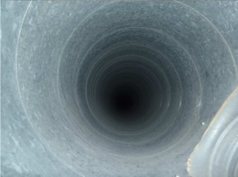
Kuva 8. Yleiskuva poistoilmakanavasta. Kanavat on puhdistettu vuonna 2010.