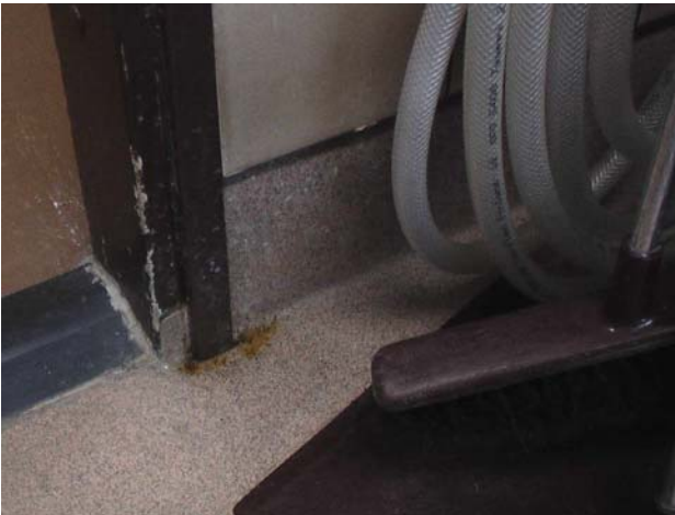
Kuva 20. Kosteuden aiheuttamaa hilseilyä keittiön oven karmissa (lähinnä esteettinen haitta).