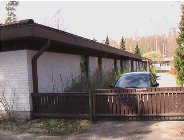
Kuva 2. Takaseinällä veden juoksumatka räystäkouruissa on turhan pitkä.