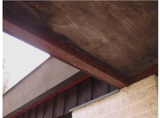
Kuva 10. Sisäänkäyntikatoksen takasivulla osoittaa ikääntymisen merkkejä. Bitumikermikatteen voisi jo uusia.