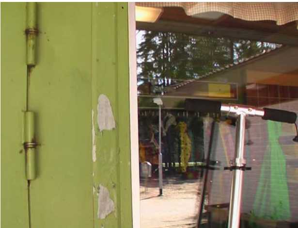
Kuva 8. Pääjulkisivun teräsovien maalipinnoite hilseilee paikoin.