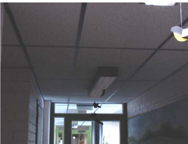
Kuva 21. Myös käytävän 32 alakatossa on vanha vuotojälki, myöskään tässä ei vuotoja ole havaittu.