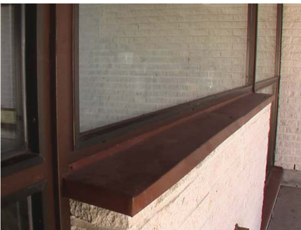
Kuva 9. Puuikkunoiden ja -ovien pintakäsittely on hyvässä kunnossa. Huomaa myös tässä vesipellin ”olematon” kaato.