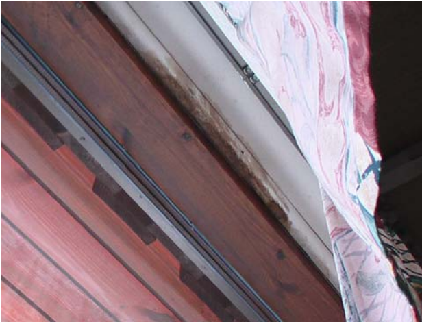
Kuva 13. Vuotojälki monitoimihallin ikkunan yläpuolella, pihan puoli. Vuoto ilmeni pari vuotta sitten ja lakkasi kun rikkonaiset kattotiilet vaihdettiin.