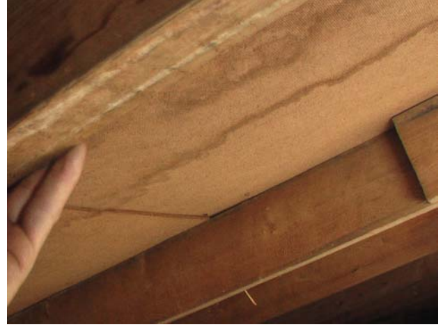
Kuva 11. Kosteusjälkiä aluskatteessa. Aluskatteena on kova puukuitulevy