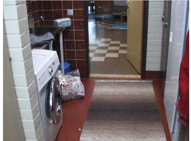
Kuva 22. Vaatehuoltohuoneessa on pesukone. Oven kynnyks saisi olla korkeampi.