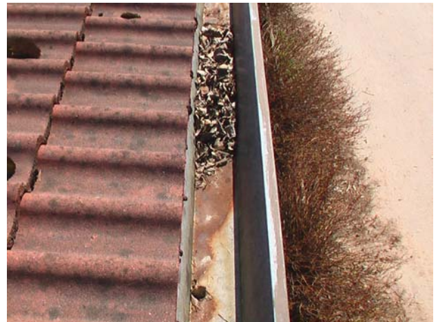
Kuva 5. Roskaa, lammikoitumista ja korroosiota räystäkouruissa (sisäkourulliset).