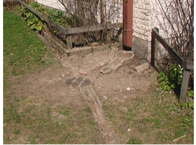
Kuva 12. Rakennuksen vierustan kuivatuksessa on puutteita. Pääsääntöisesti kaikki loiskevesikourut kaipaavat puhdistusta ja/tai kunnostusta.