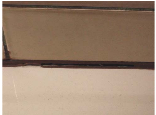
Kuva 17. Kylpyammeen silikonikittauksissa on puutteita pesuhuoneessa 04.