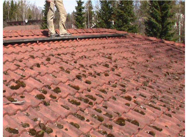
Kuva 4. Kattotiilien sammaloitumista. Tiilikate tulisi pestä muutaman vuoden välein.