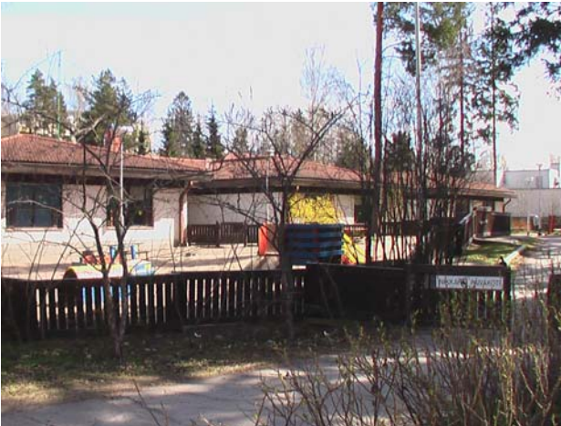
Kuva 1. Julkisivut ovat hyvässä kunnossa yleisilmeeltään. Kuvassa on rakennuksen pääjulkisivu.