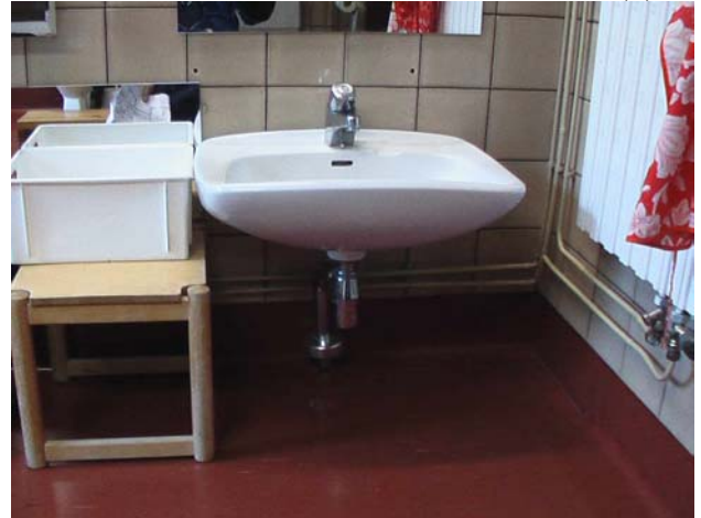
Kuva 16. Kaikki vesipisteet tarkastettiin. Kuvan lavuaarin kiinnitys on löysällä (huone 34).