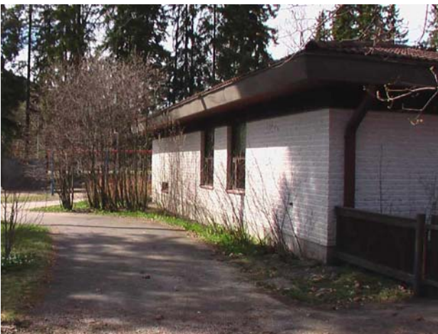
Kuva 3. Päätty kaakkoon on vastaava kuin päätty luoteeseen, kunnossa ei huomauttamista.