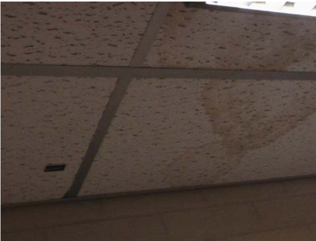
Kuva 14. Vanha vuotojälki käytävän 15 alakatossa. Päiväkodin johtajan mukaan tässä kohtaa ei vesivuotoja ole ollut (rakennusaikainen vuotojälki?).