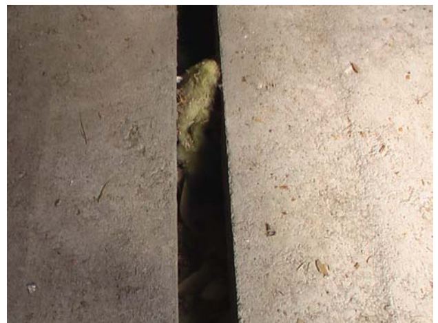
Kuva 6. Yläpohjassa on Nilcon- elementit. Pintalaa- tan saumat ovat auki, ne voisi täyttää villalla ja sen jälkeen tiivistää vedenpitäviksi mahdollisen vesikat- tovuodon varalta.