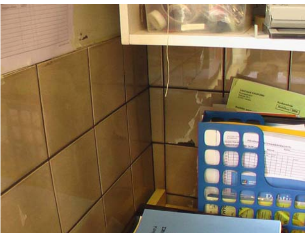
Kuva 15. Rakenteellinen halkeama keittiön seinälaatoituksessa. Suositellaan saamaamista tai kit-taamista.