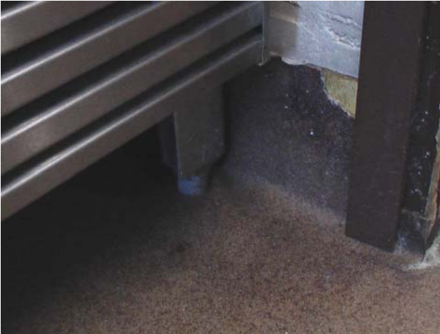
Kuva 19. Kalustejalca on tehnyt reiän keittiön lattiainmattoon. Suositellaan korjaamista (roiskevesialue).