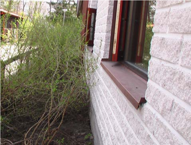
Kuva 7. Ikkunapeltien kaadot ovat liian loivat.