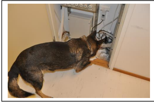
Koiraa ilmaisee ilmavuodon sähkökaapista