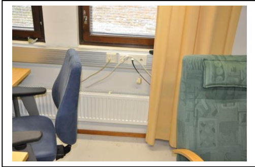
Valokuva toimistosta nro 16, ikkunaseinä tasakattoa vasten

Postiosoite: Harjulantie 87 29340 KULLAA Y-tunnus: 1898673-6