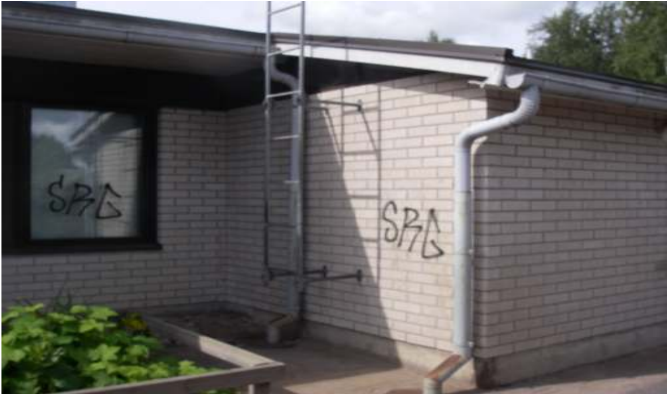
KUVA 41. Yleiskuva päärakennuksen seinustalla olevista tikkaista.