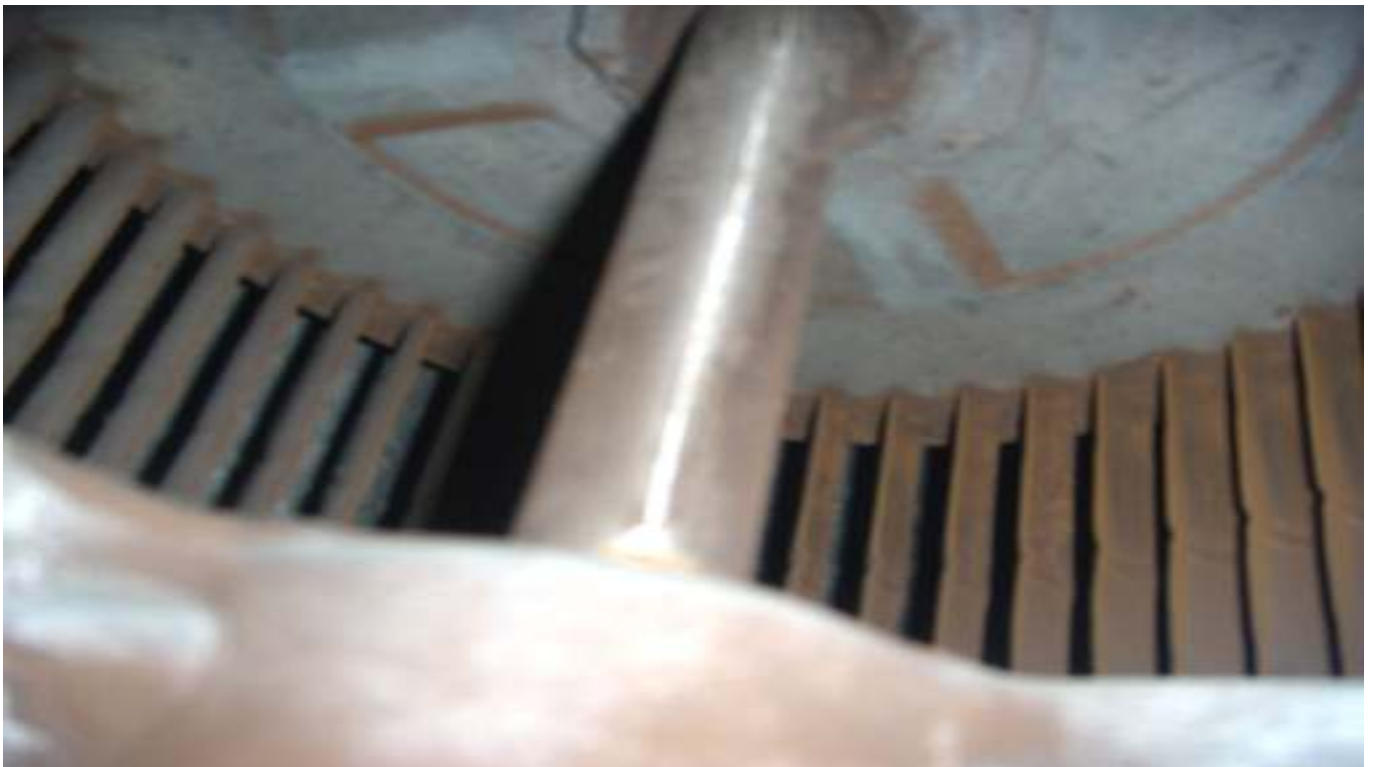
KUVA 23. Yleiskuva lisärakennuksen poistoilmapuhaltimesta.