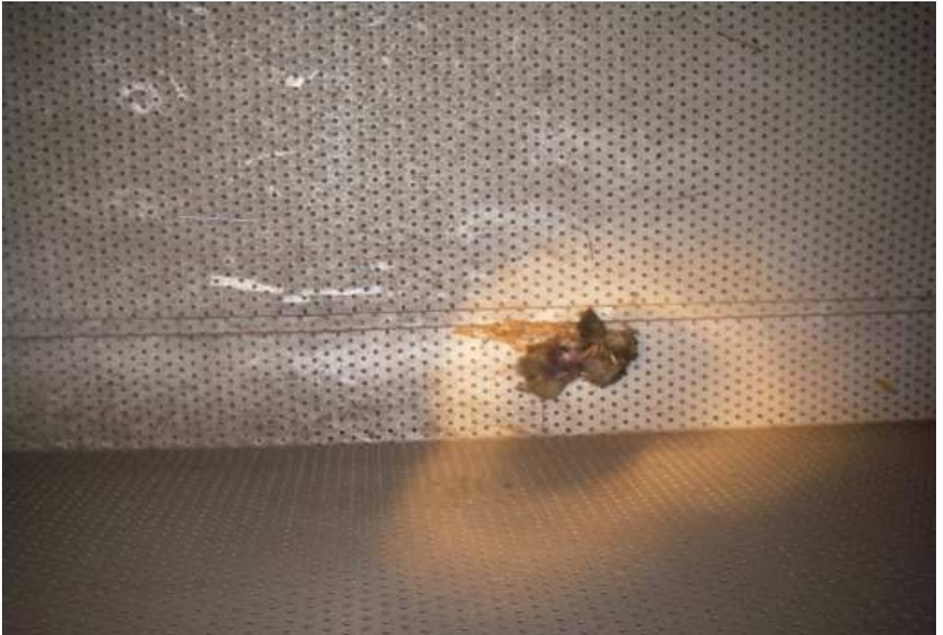
KUVA 12. Yleiskuva päärakennuksen tuloilmakammioista.