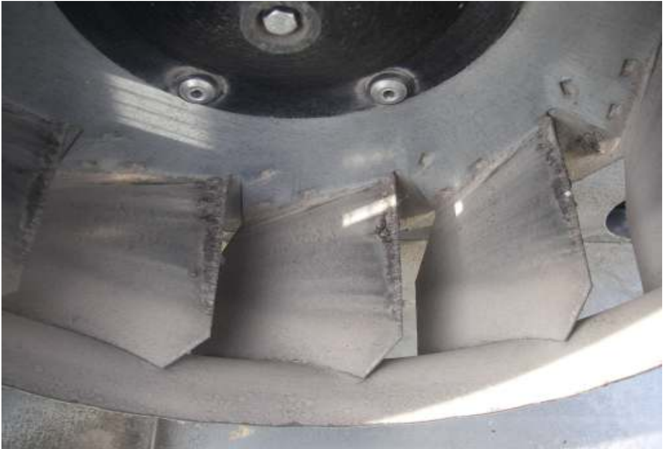
KUVA 14. Yleiskuva päärakennuksen huippuimurista.