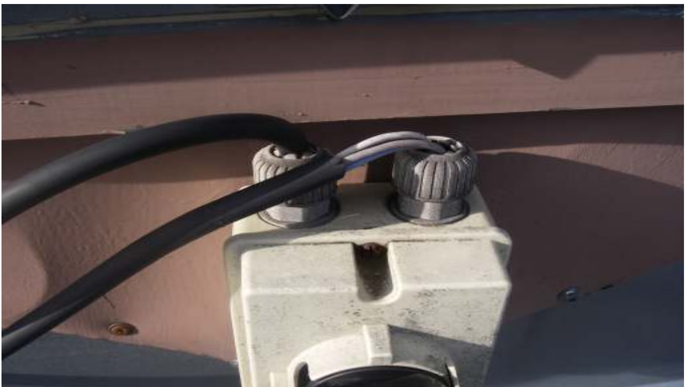
KUVA 15. Yleiskuva päärakennuksen huippuimurin sähköjohtojen kytkennästä.