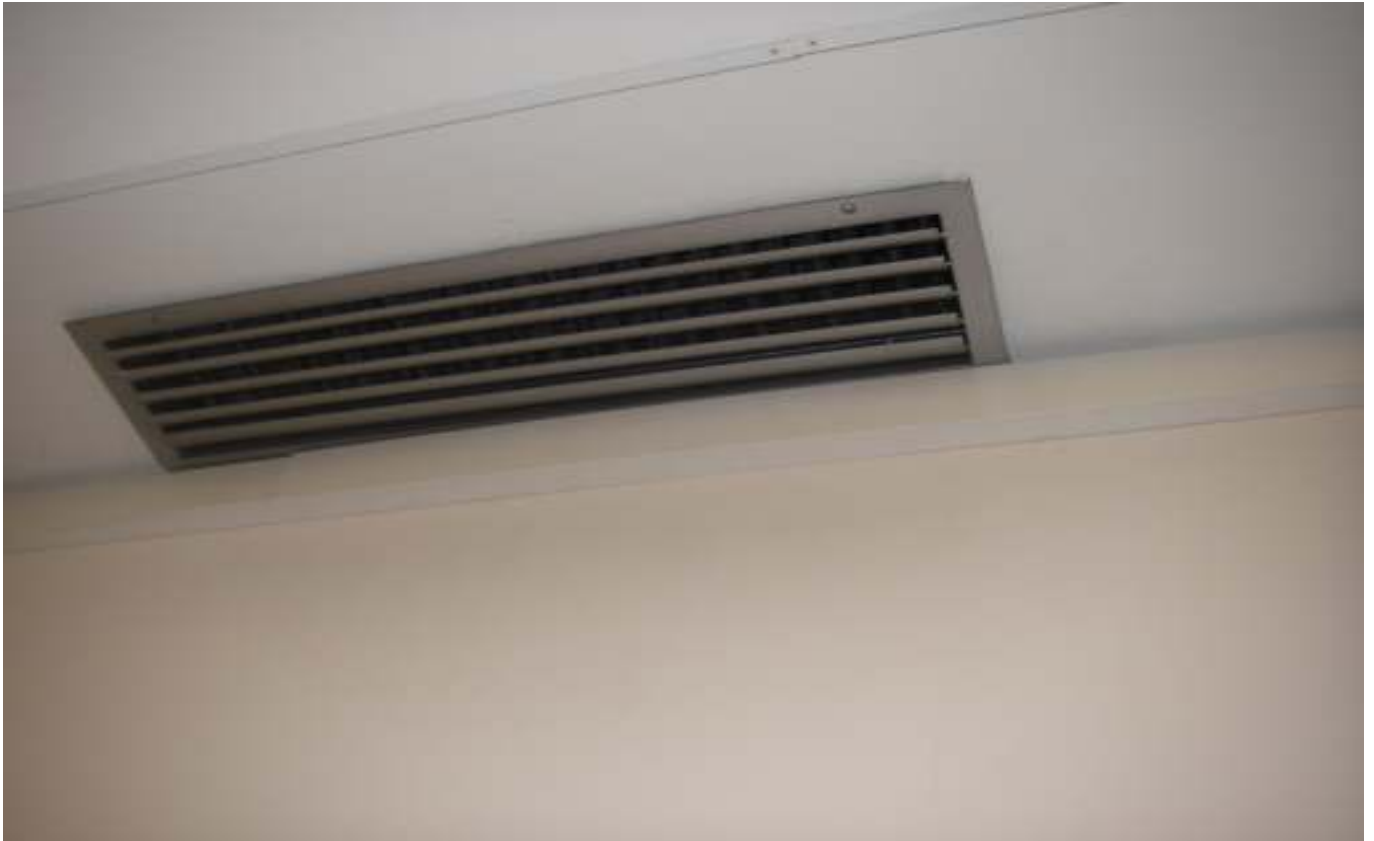
KUVA 35. Yleiskuva päärakennuksen kattohajottajasta.