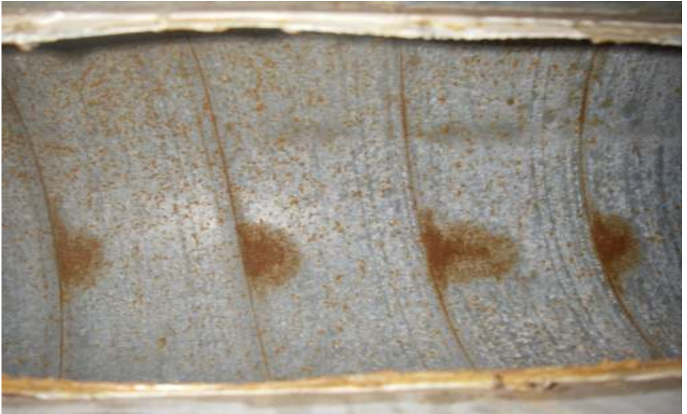
KUVA 31. Yleiskuva ryhmähuoneen n:o 38 tuloilmakanavasta.