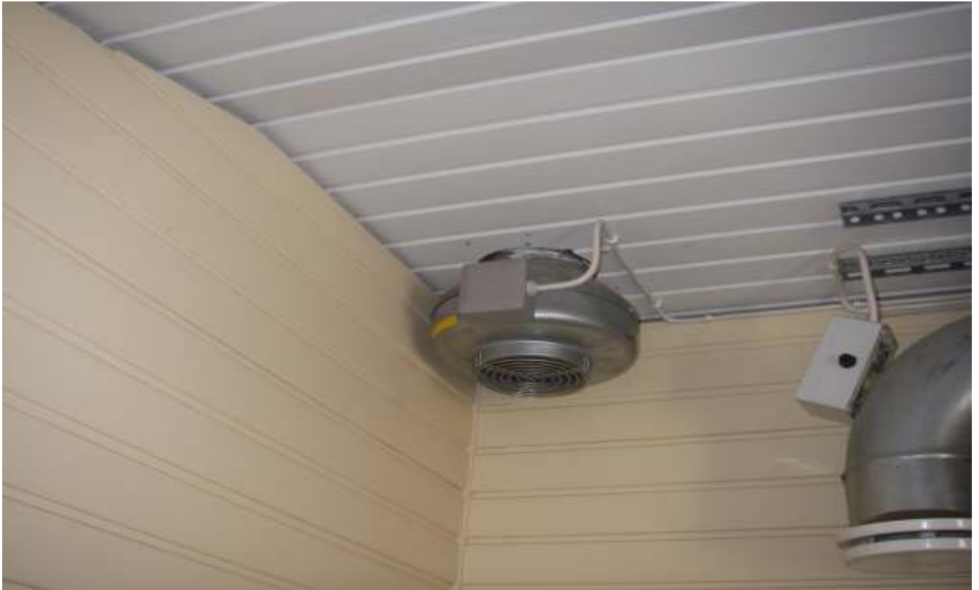
KUVA 45. Yleiskuva päärakennuksen huoneen n:o 14 poistoilmapuhaltimesta.