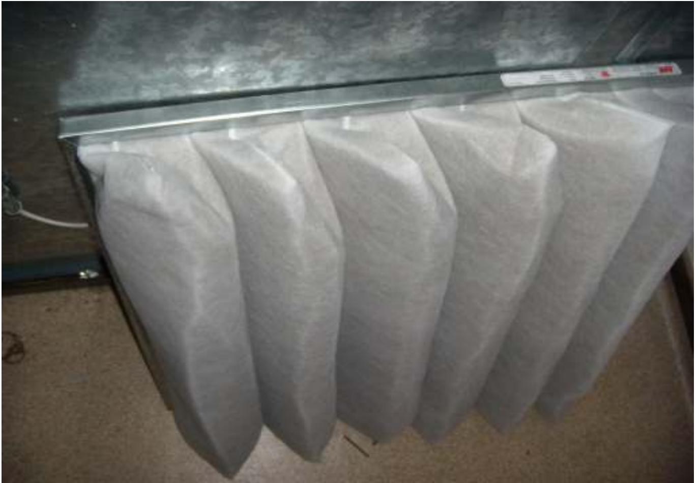
KUVA 22. Yleiskuva lisärakennuksen poistoilmasuodattimesta.