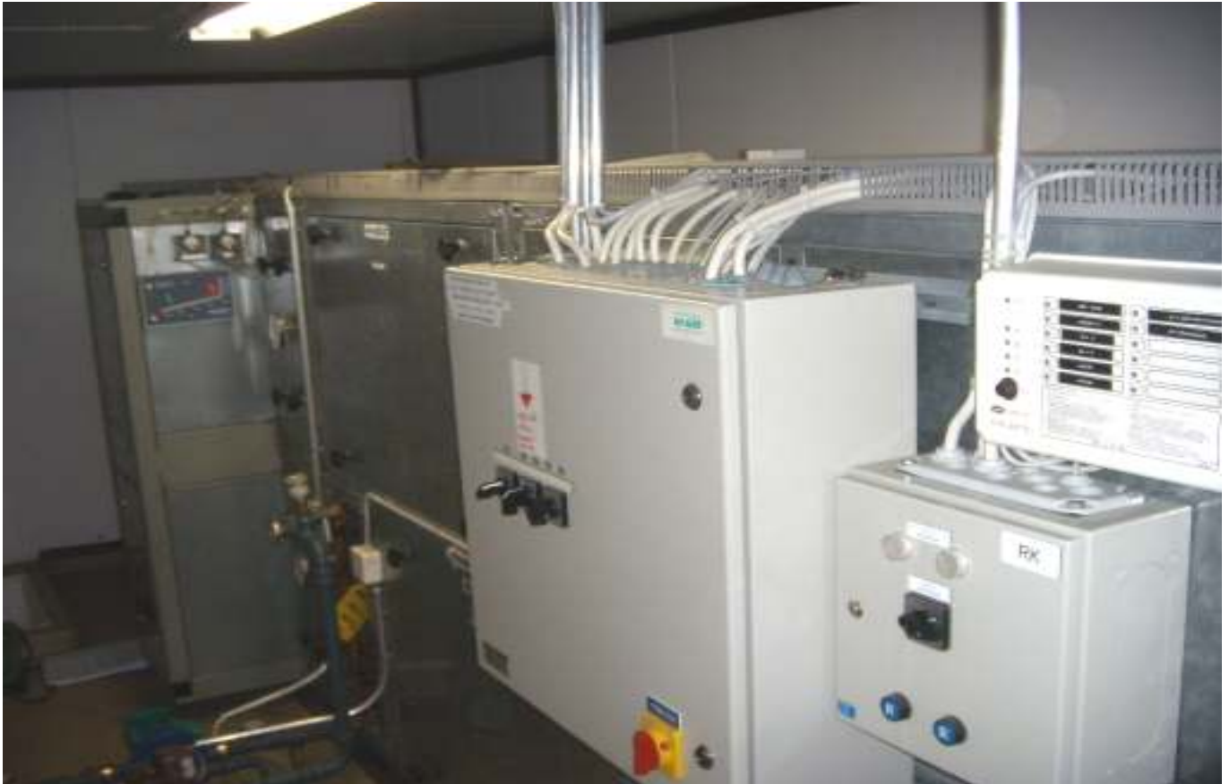
KUVA 3. Yleiskuva lisärakennuksen ilmastointikoneesta.