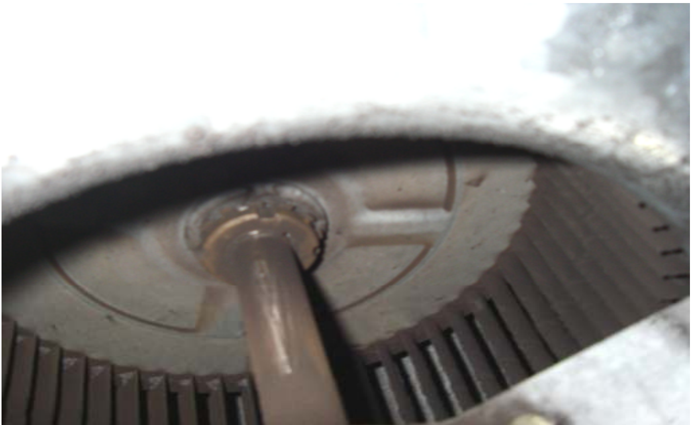
KUVA 21. Yleiskuva lisärakennuksen tuloilmapuhaltimesta.