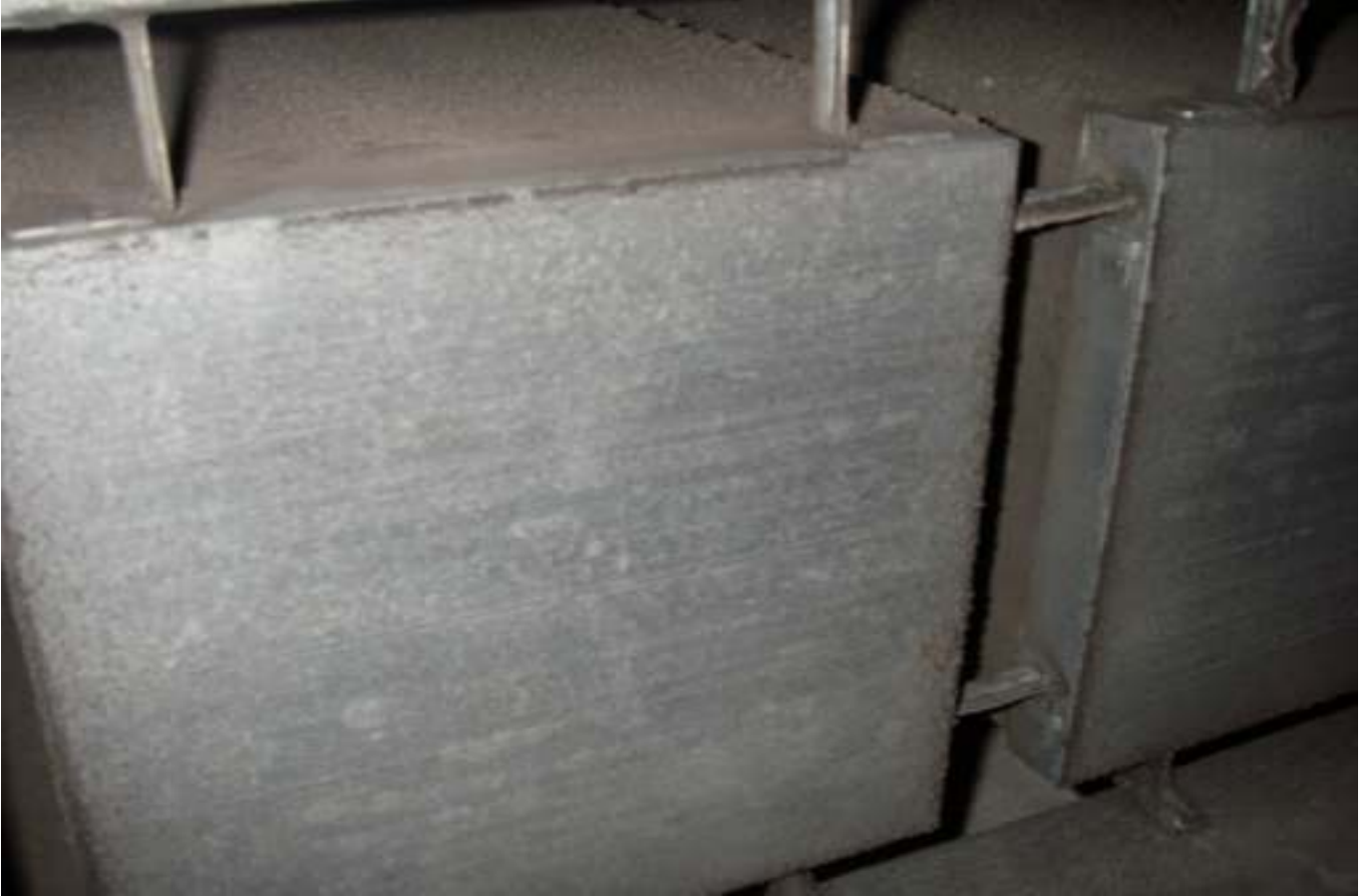
KUVA 24. Yleiskuva lisärakennuksen poistoilmakanavan äänenvaimentimesta.