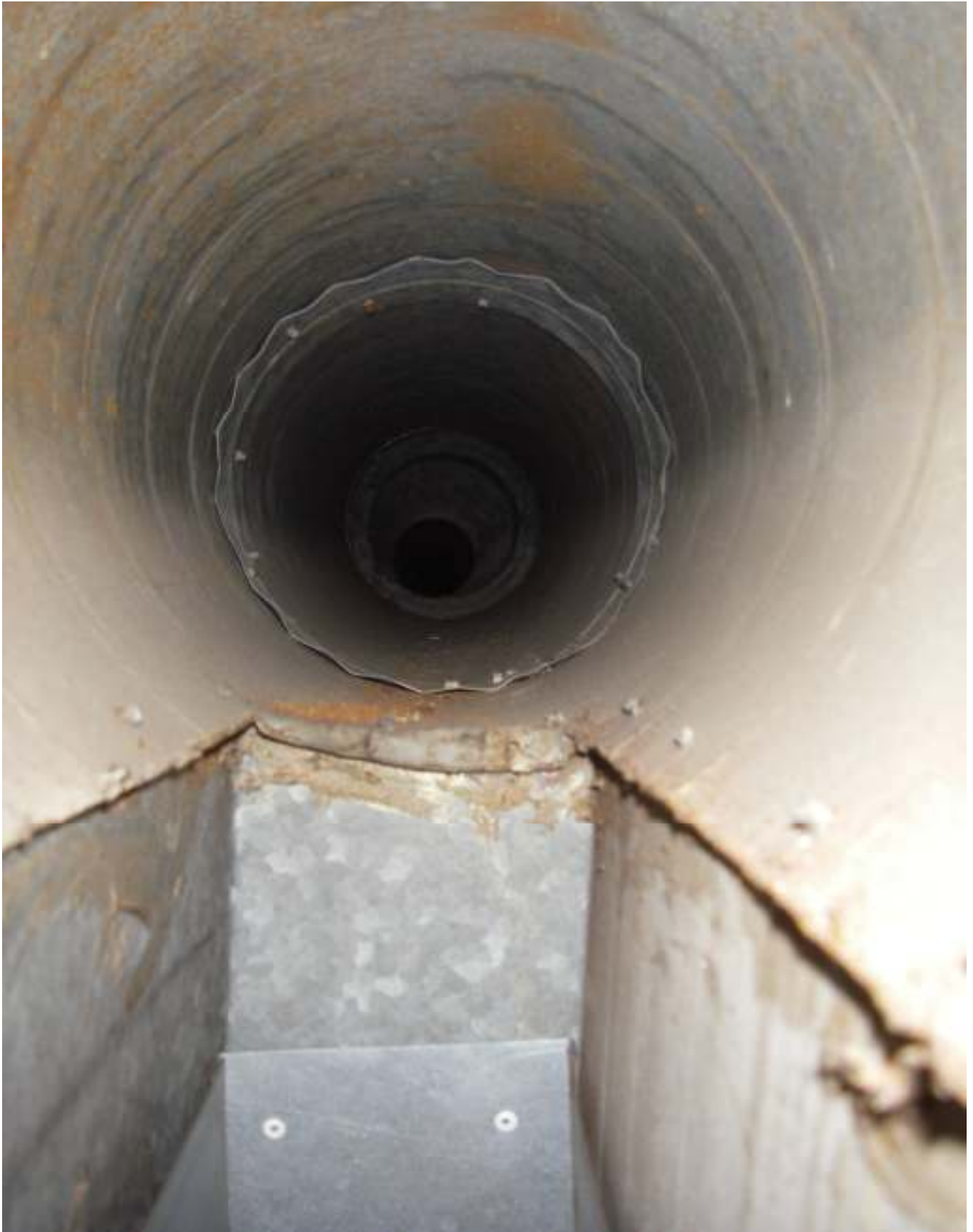
KUVA 26. Yleiskuva päärakennuksen tuloilmakanasta.