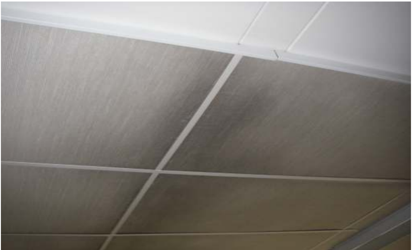
KUVA 46. Yleiskuva lisärakennuksen katosta.