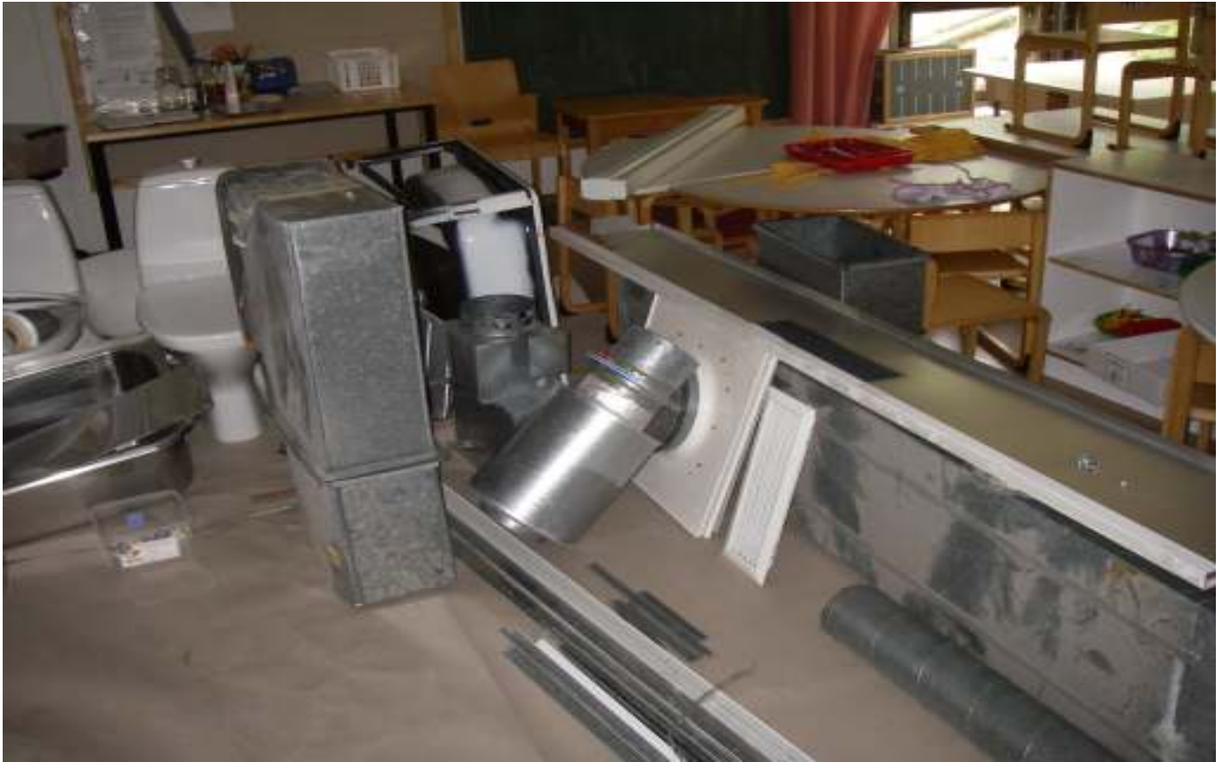
KUVA 37. Yleiskuva lisärakennuksen sisätiloista.