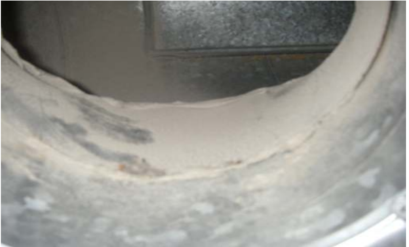
KUVA 27. Yleiskuva päärakennuksen poistoilmakanavasta.