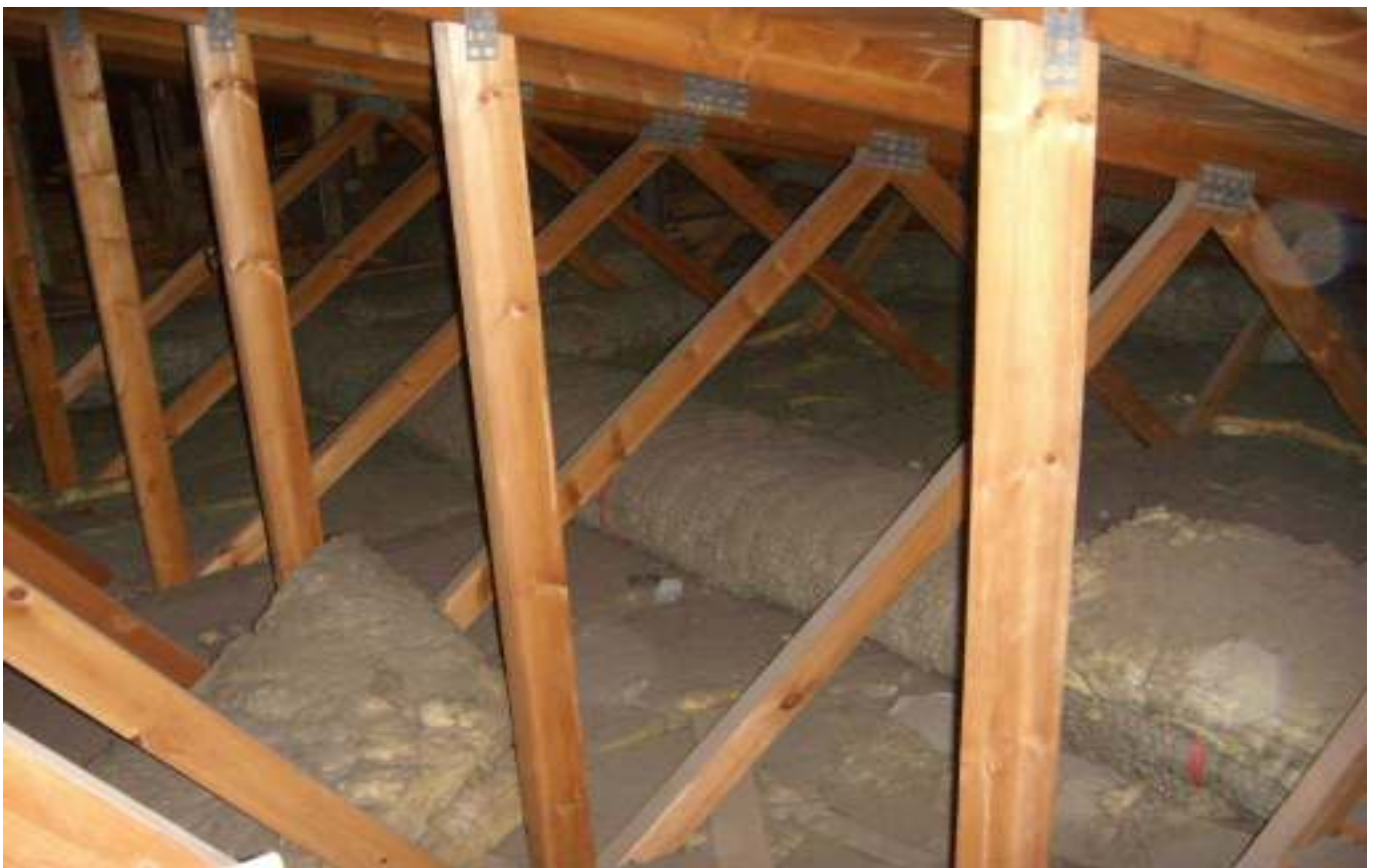
KUVA 32. Yleiskuva päärakennuksen ullakotiloista.