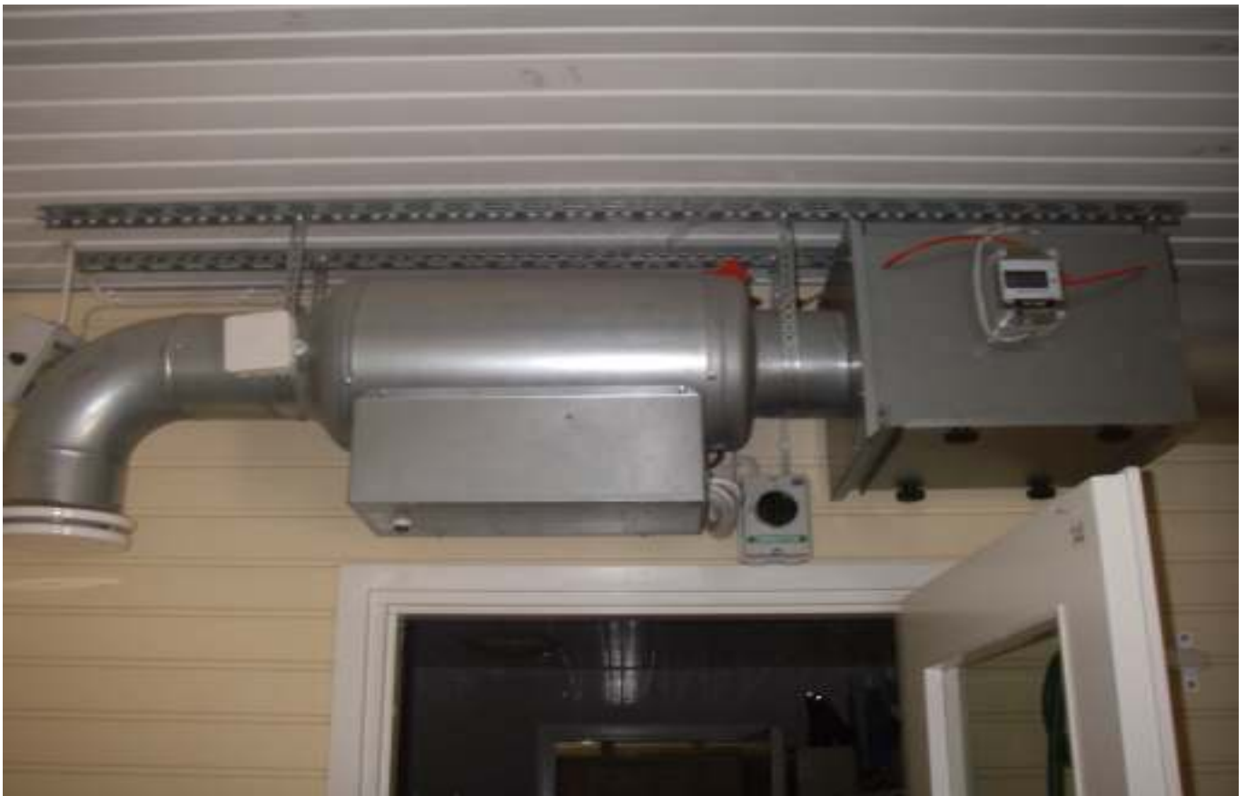
KUVA 44. Yleiskuva päärakennuksen huoneen n:o 14 tuloilmapuhaltimesta.