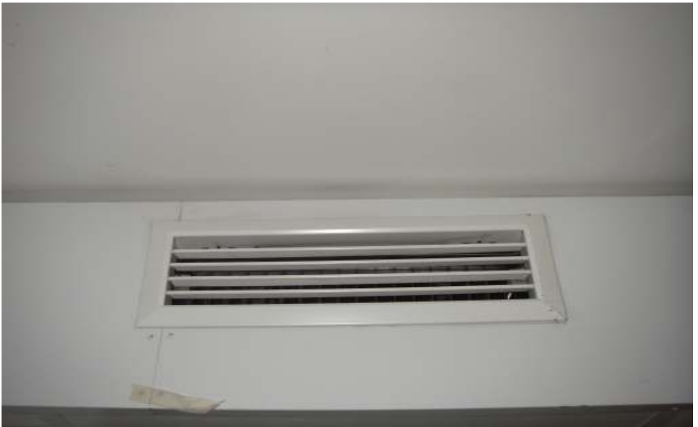
KUVA 36. Yleiskuva päärakennuksen ritiläsäleiköstä.