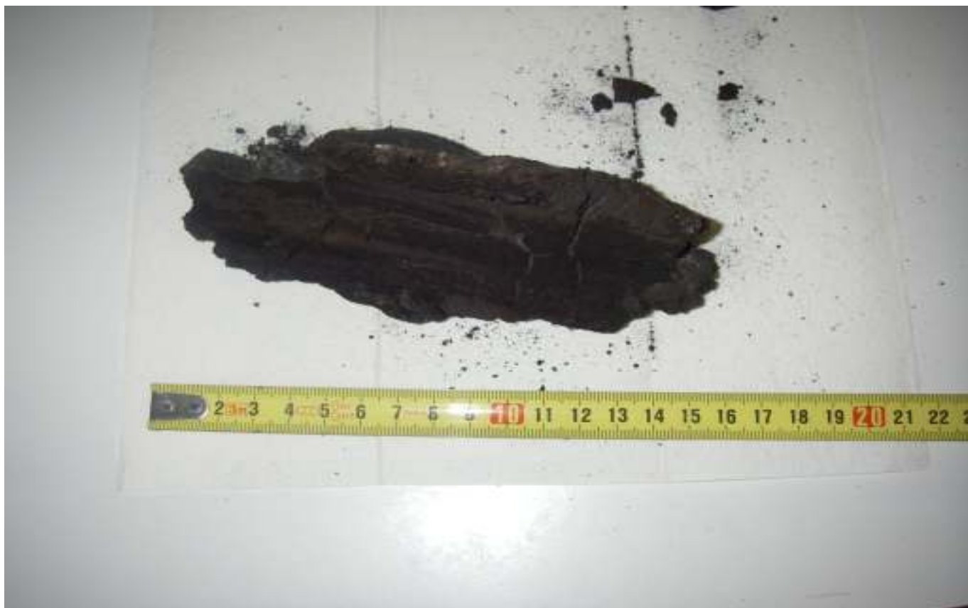
KUVA 29. Yleiskuva päärakennuksen tuloilmakanavasta poistetusta roskasta.