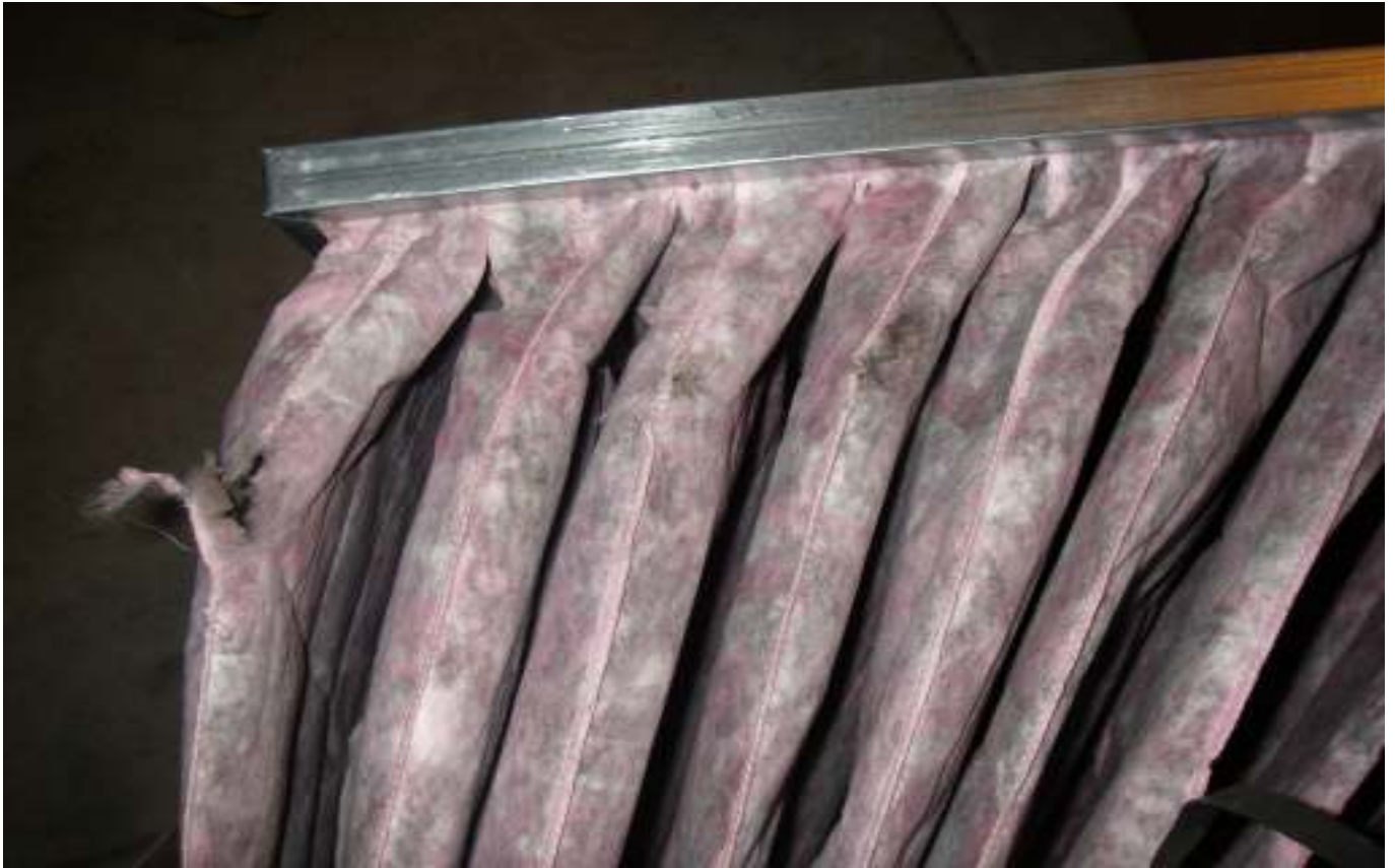
KUVA 10. Yleiskuva päärakennuksen tuloilmakoneen lisäsuodattimesta, joka on rikki.