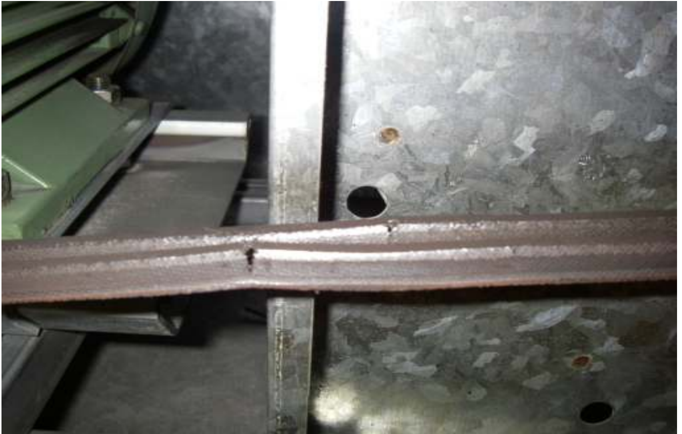
KUVA 20. Yleiskuva lisärakennuksen tuloilmakoneen hihnoista.