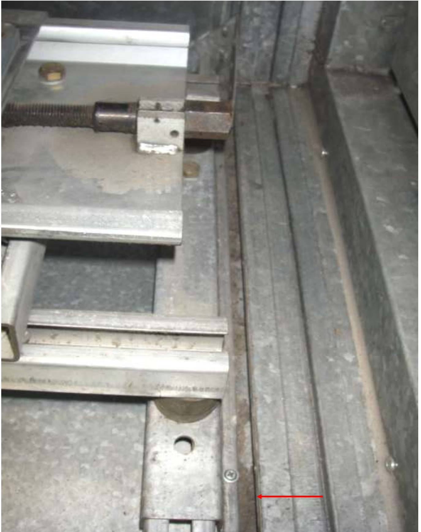
KUVA 18. Yleiskuva lisärakennuksen tuloilmakoneen kammiosta, jossa on roskaa.