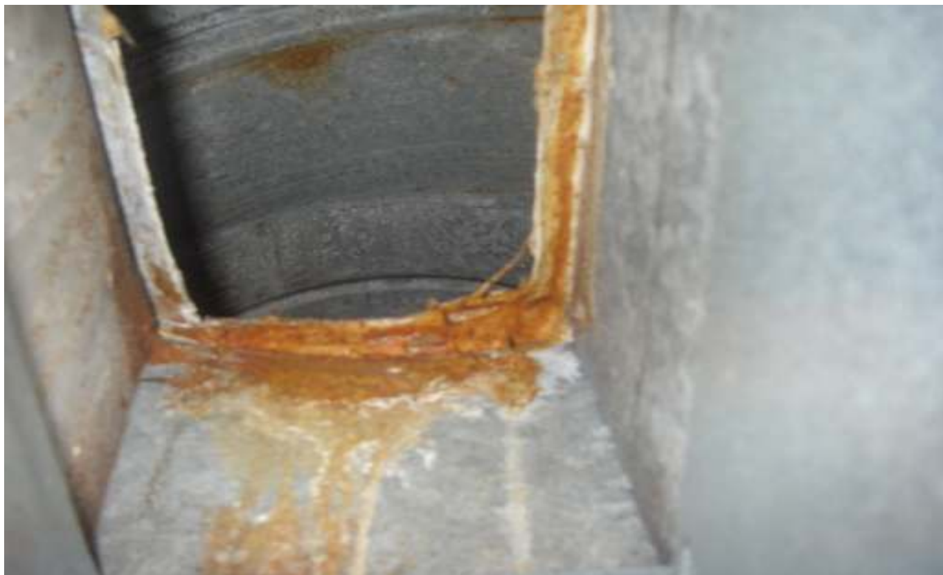
KUVA 30. Yleiskuva ryhmähuoneen n:o 38 tuloilmakanavasta.