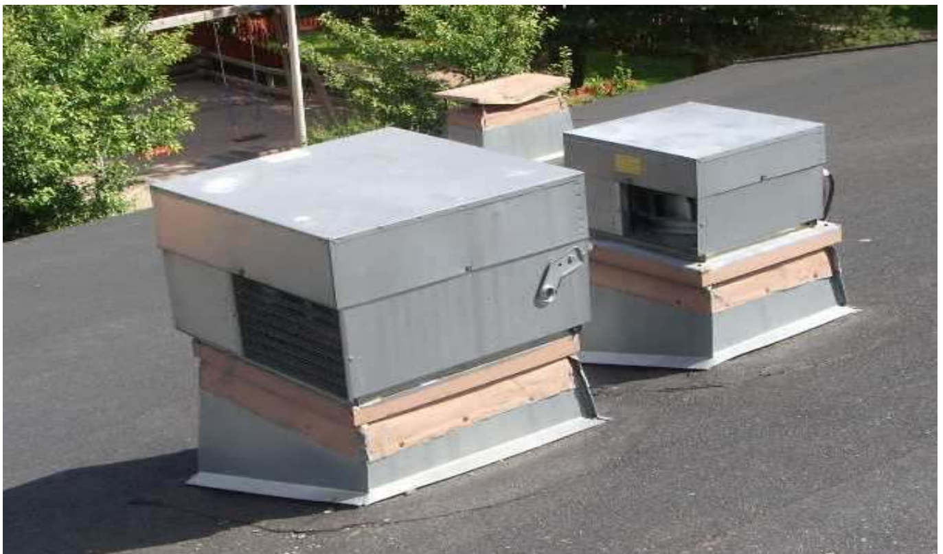
KUVA 2. Yleiskuva päärakennuksen vesikatolla olevista huippuimureista.