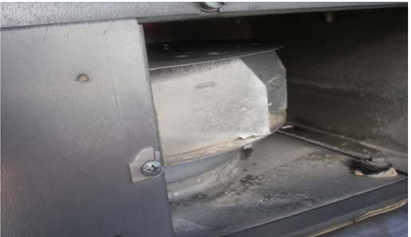
KUVA 25. Yleiskuva päärakennuksen vesikatolla olevasta huippuimurista, josta puuttuu suojaritilä.