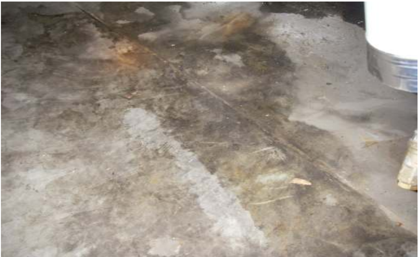
KUVA 4. Yleiskuva päärakennuksen ilmastointihuoneen muovimatosta.