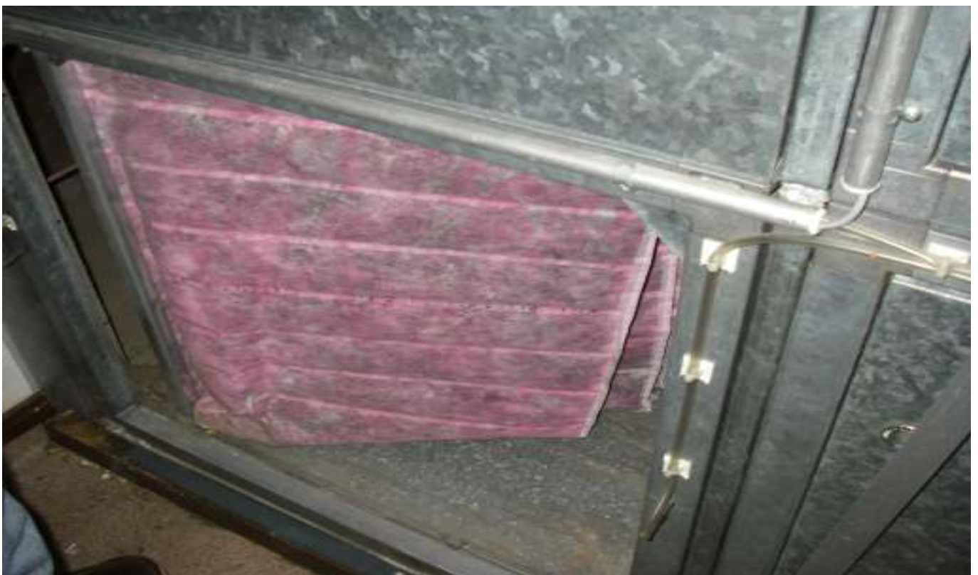
KUVA 17. Yleiskuva lisärakennuksen tuloilmakoneen suodattimista.