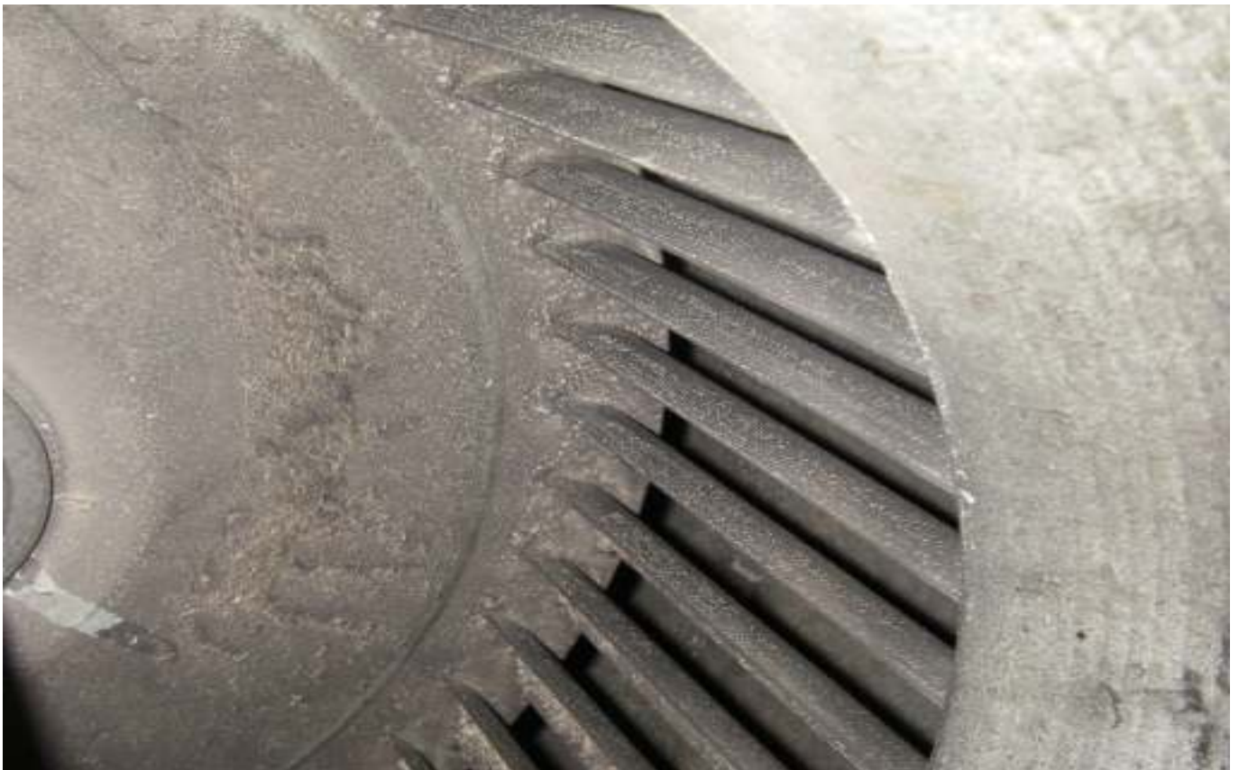
KUVA 9. Yleiskuva päärakennuksen tuloilmapuhaltimesta.