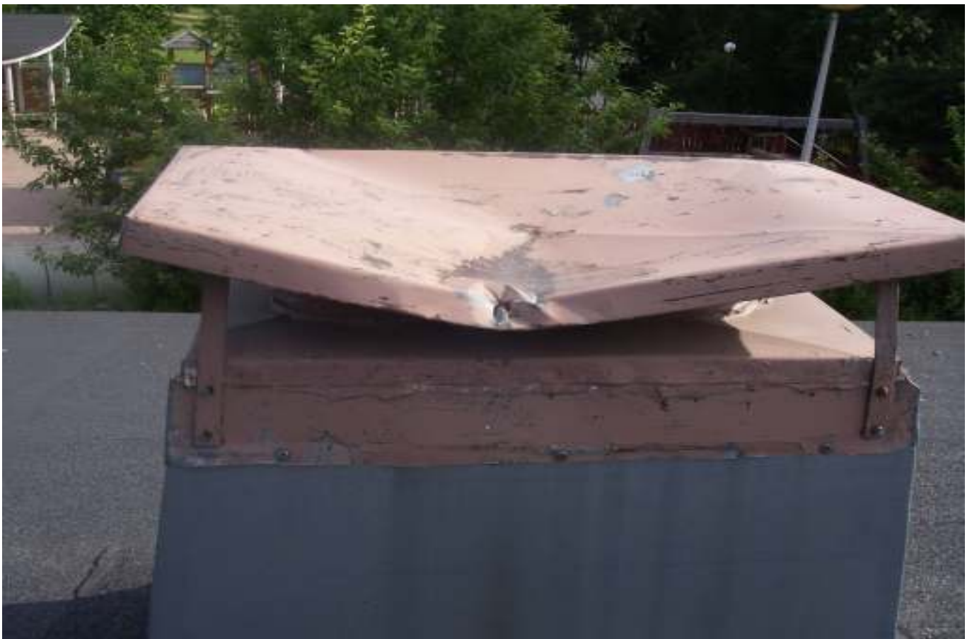
KUVA 40. Yleiskuva LJ- huoneen ilmastointihormin sadehatusta, joka on painettu kasaan.