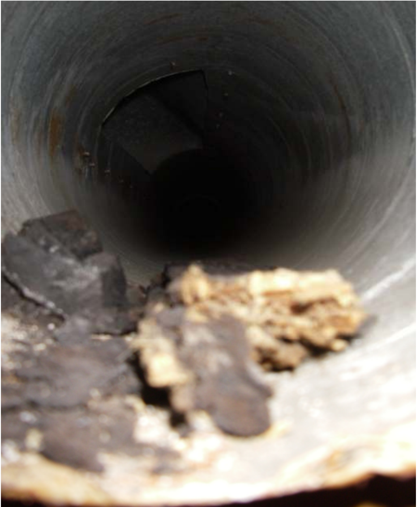
KUVA 28. Yleiskuva päärakennuksen ryhmähuoneen n:o 38 tuloilmakanavasta.