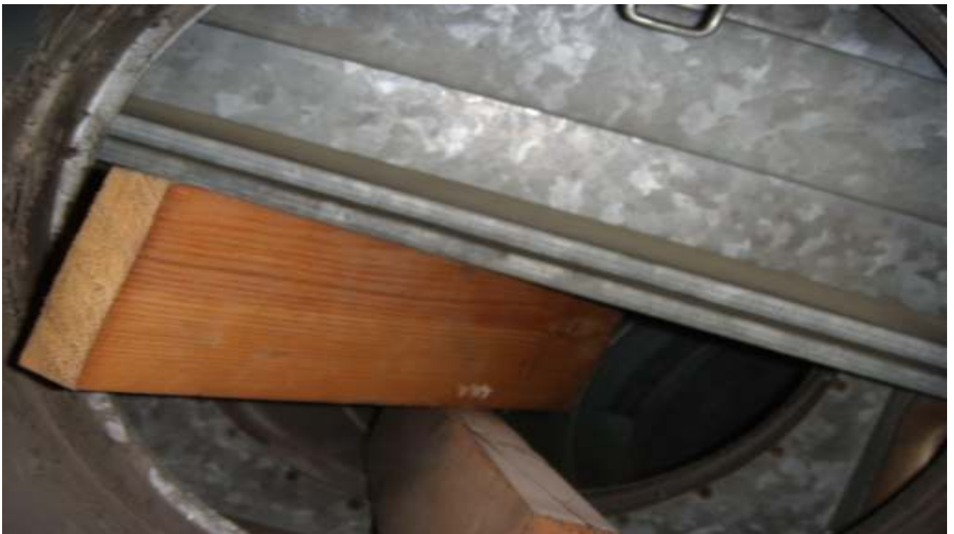
KUVA 13. Yleiskuva päärakennuksen ilmastointikanavan palopelistä.