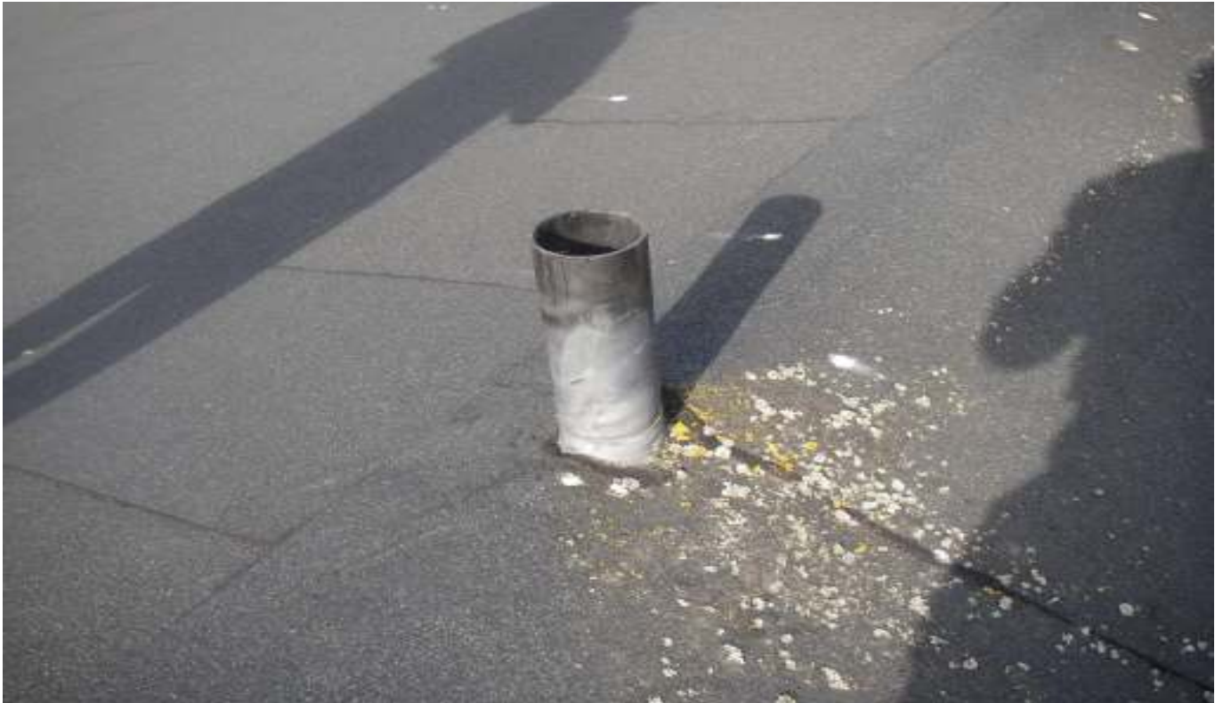
KUVA 39. Yleiskuva ullakkotilojen tuuletusputkesta, josta puuttuu sadehattu.