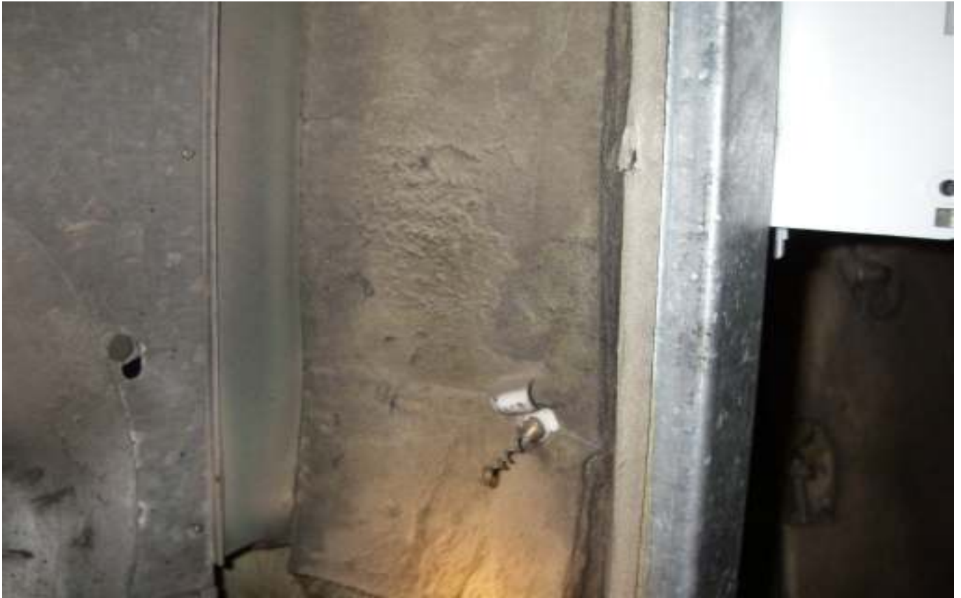
KUVA 8. Tuloilmakoneen kammiot ovat villapintaeristettä, joka on paikoin rikki.