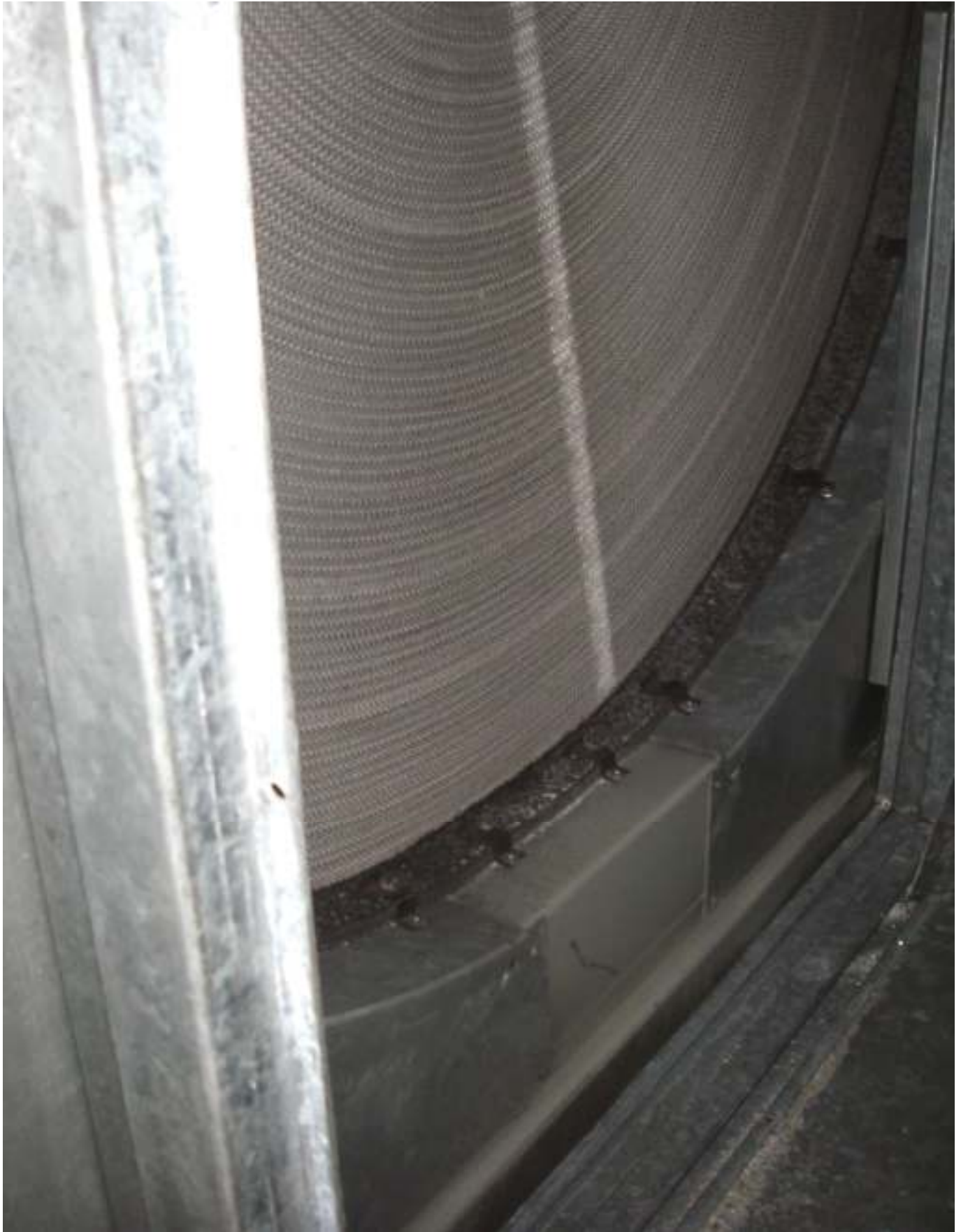
KUVA 19. Yleiskuva lisärakennuksen LTO- kiekosta.