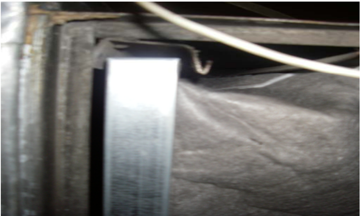
KUVA 6. Yleiskuva päärakennuksen tuloilmakoneen esisuodattimen kehikosta.