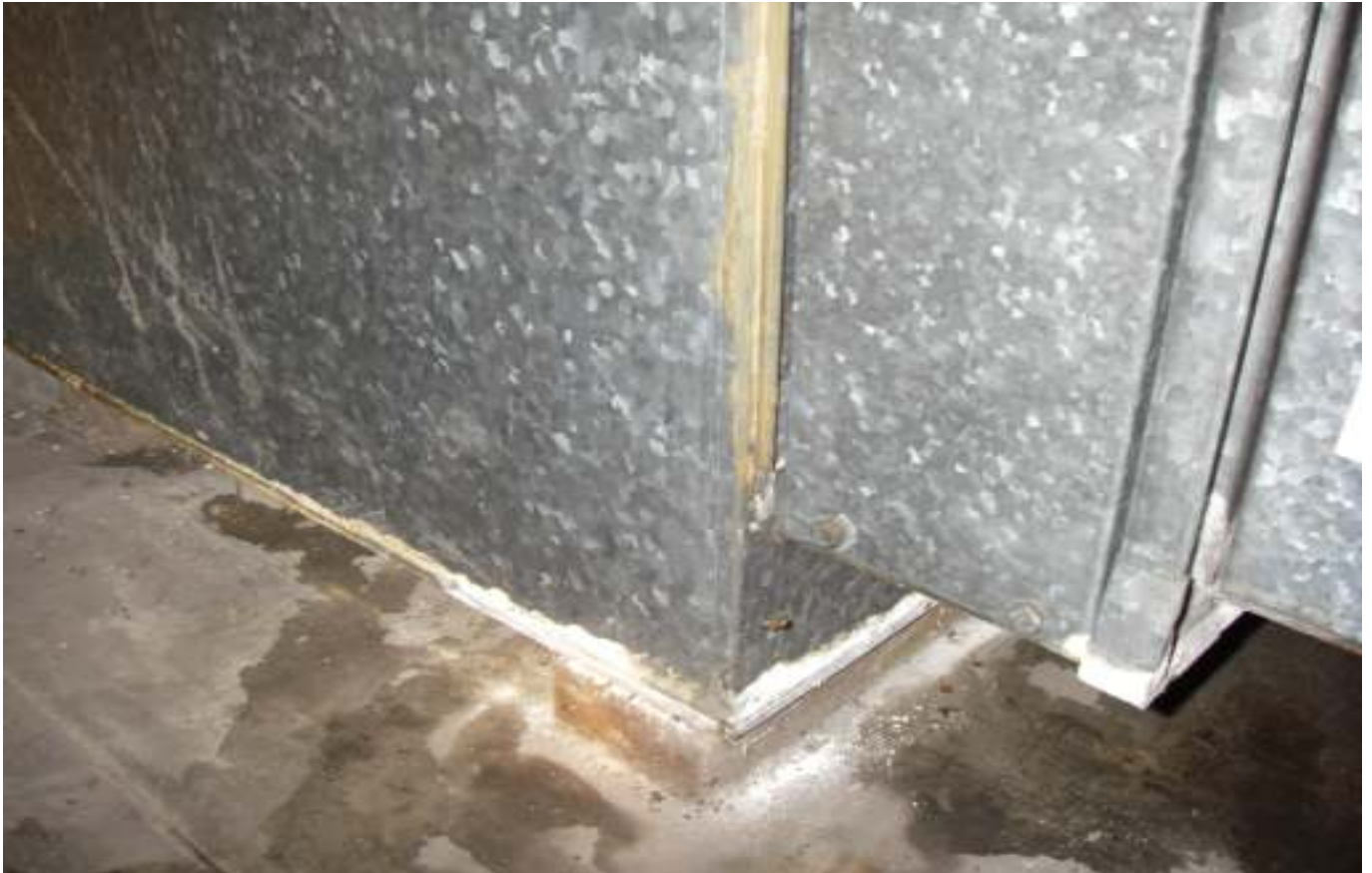
KUVA 5. Yleiskuva päärakennuksen tuloilmakoneen raitisilmakammista.