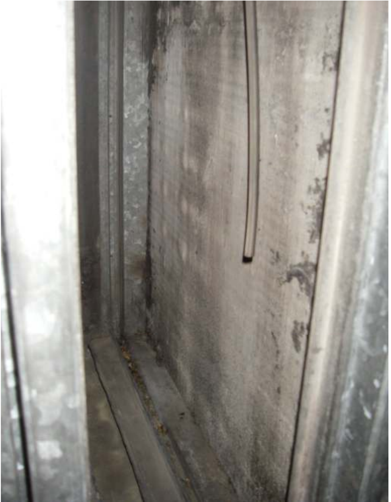
KUVA 7. Yleiskuva päärakennuksen tuloilmakoneen lämpöpatterista.