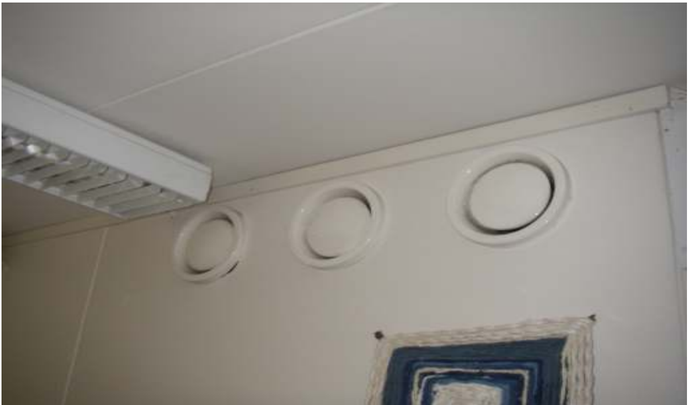
KUVA 38. Yleiskuva poistoilmaventtiileistä.