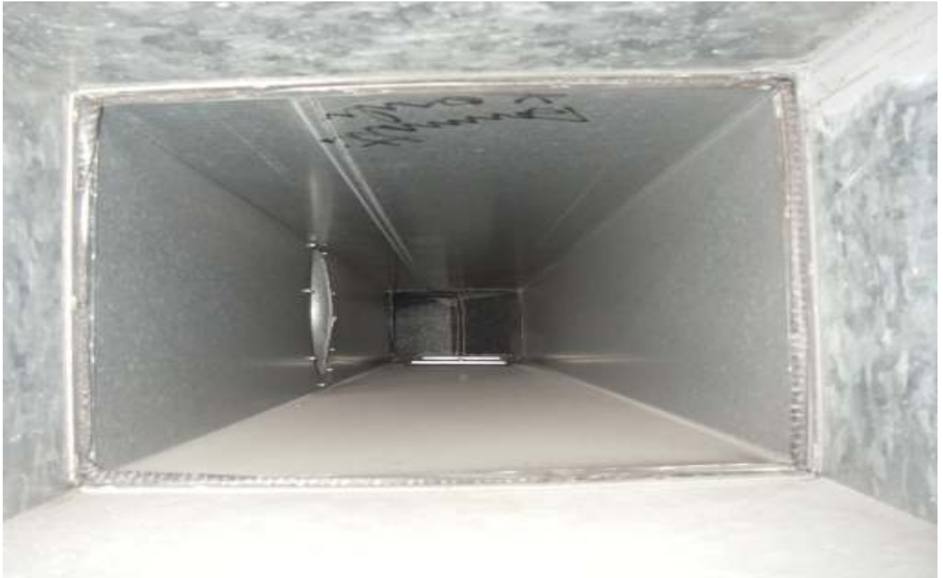
KUVA 33. Yleiskuva lisärakennuksen tuloilmakanavasta.