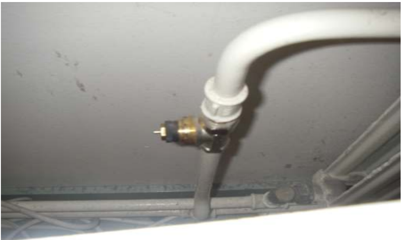
KUVA 42. Yleiskuva päärakennuksen rikkiäisestä patteriventtiilistä.