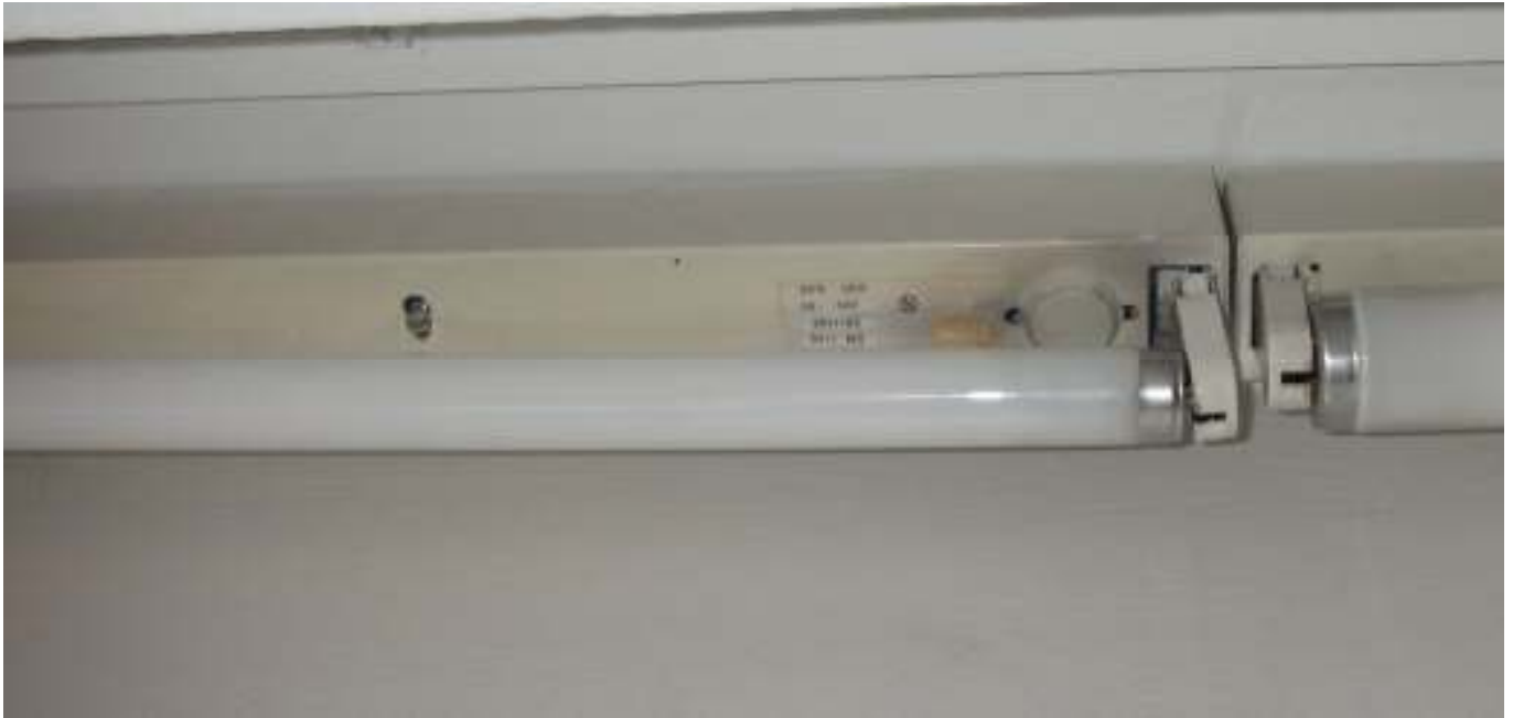
KUVA 43. Yleiskuva päärakennuksen ryhmähuoneen n:o 03 loisteputken kiinnityksestä.