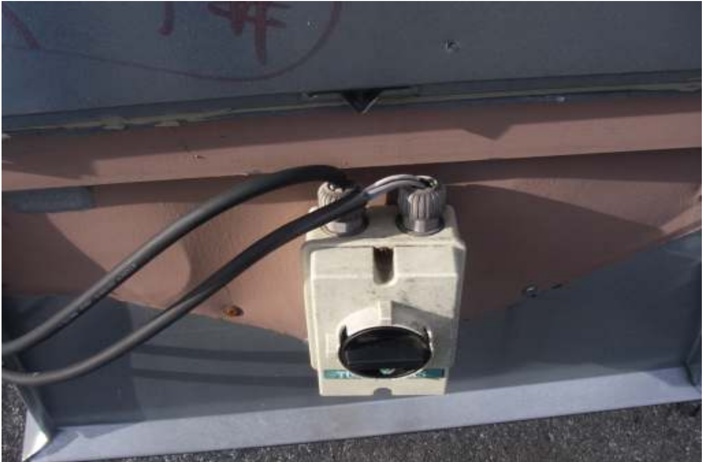
KUVA 16. Yleiskuva päärakennuksen vesikatolla olevista turvakytkimistä.