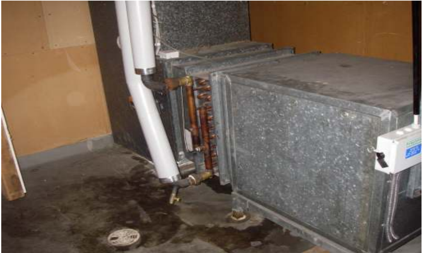
KUVA 1. Yleiskuva päärakennuksen tuloilmakoneesta.