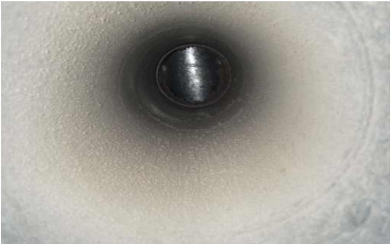
KUVA 34. Yleiskuva lisärakennuksen poistoilmakanavasta.