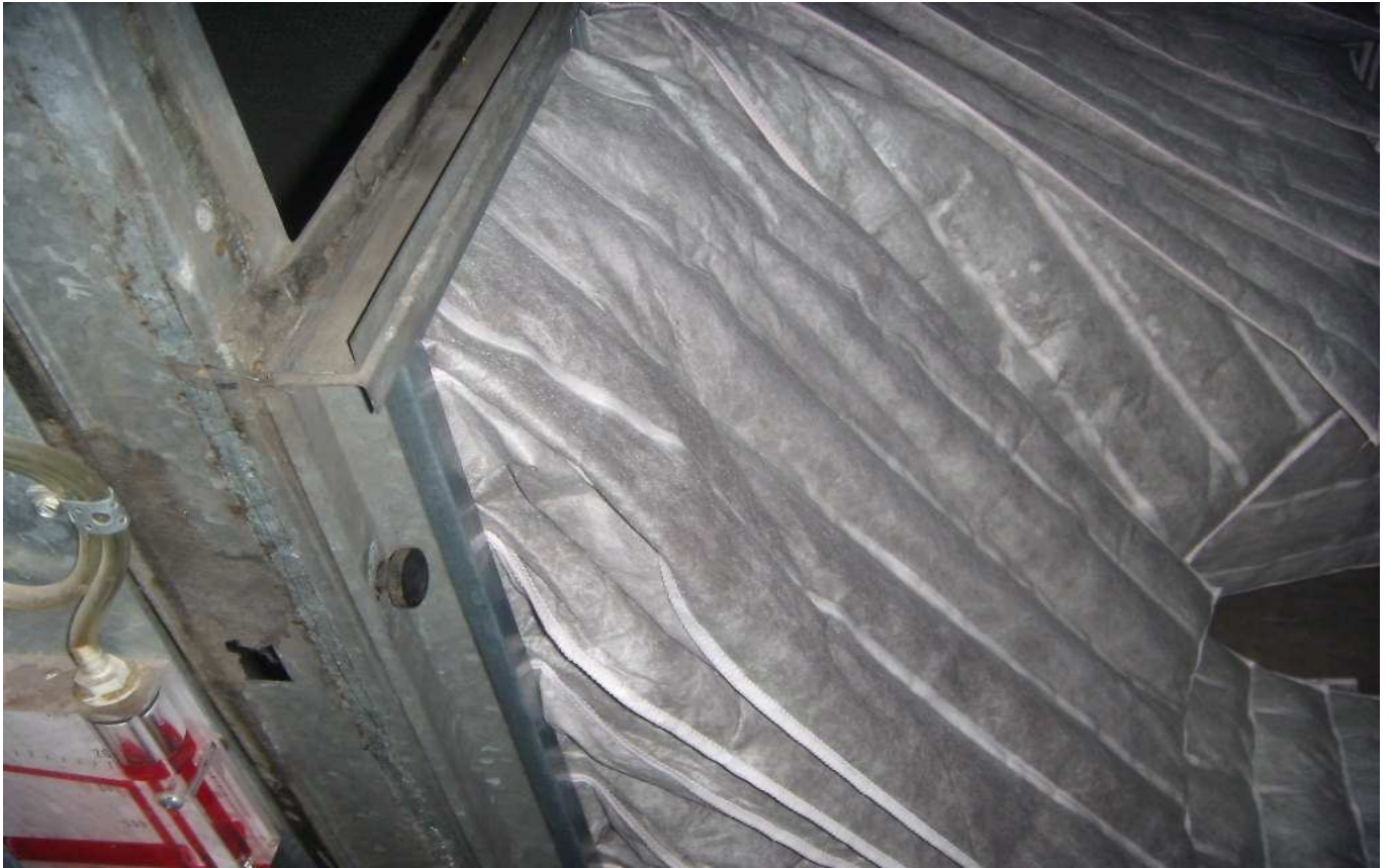
KUVA 5. Yleiskuva tuloilmasuodattimista (TIK 2.2).