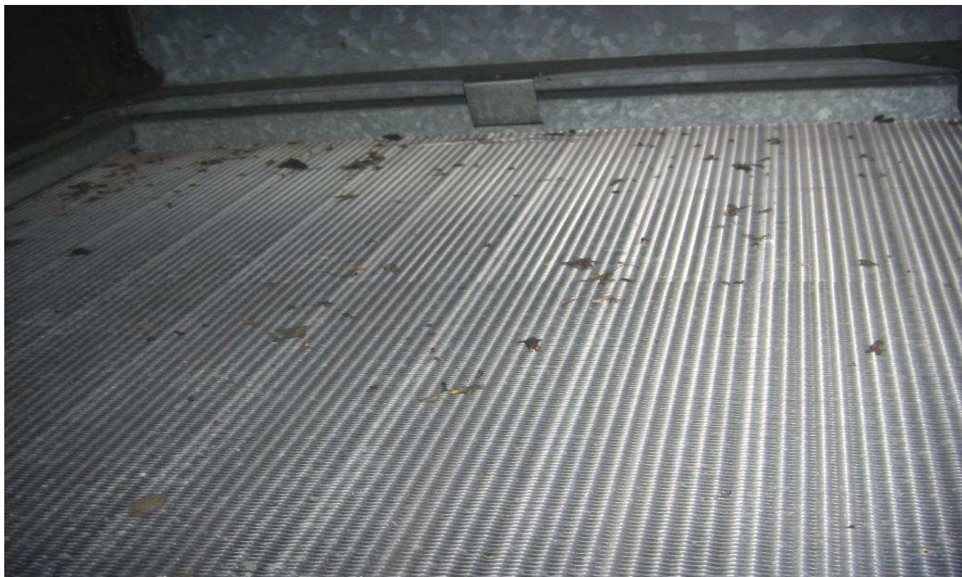
KUVA 11. Yleiskuva lämpöpatterista (TIK 3.1).