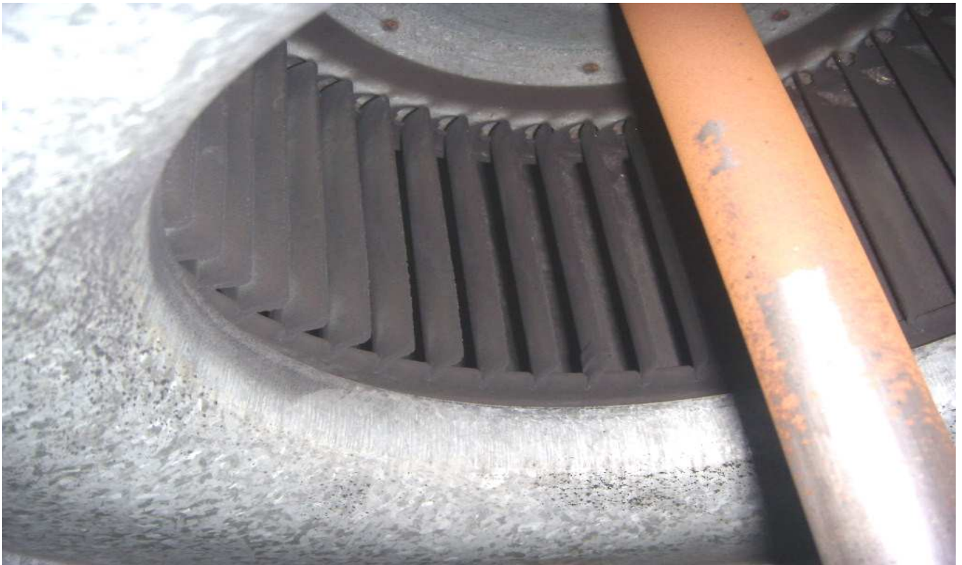
KUVA 14. Yleiskuva tuloilmapuhaltimesta.