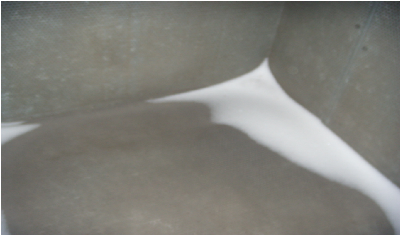
KUVA 6. Yleiskuva tuloilmakoneen raitisilmakammioista (TIK 2.2).