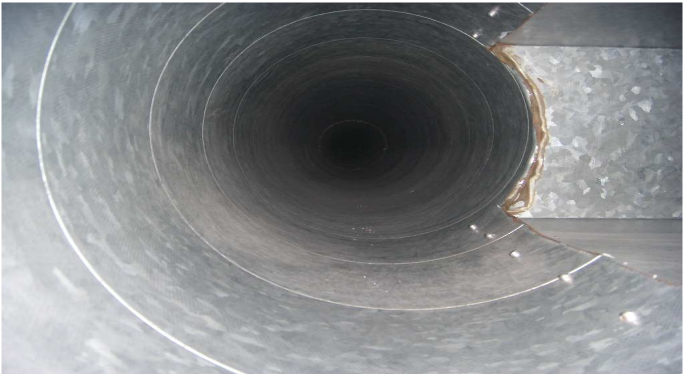
KUVA 19. Yleiskuva tuloilmakanavasta.