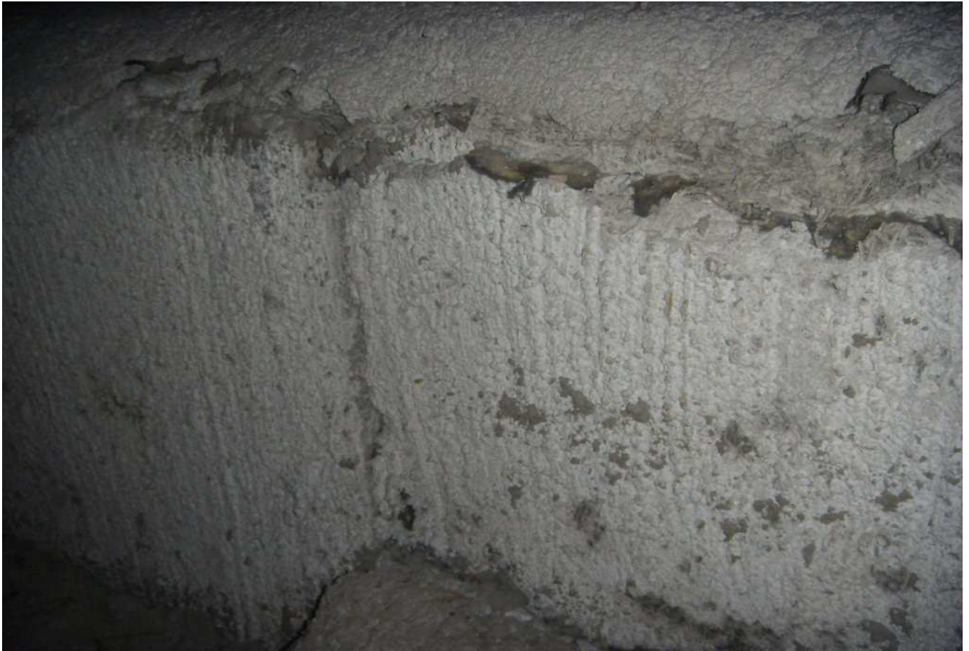
KUVA 18. Yleiskuva rakenneaineisesta poistoilmakanavasta.