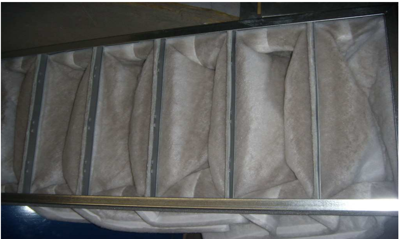
KUVA 4. Yleiskuva poistoilmasuodattimista.