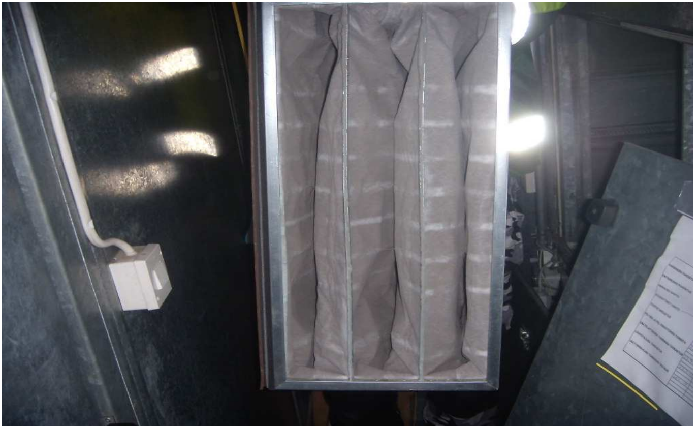
KUVA 15. Yleiskuva poistoilmasuodattimista.