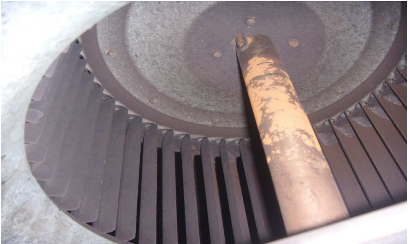
KUVA 8. Yleiskuva tuloilmapuhaltimesta.