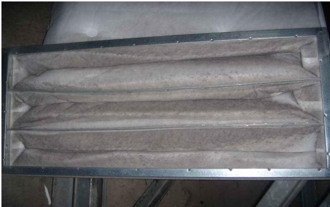
KUVA 10. Yleiskuva poistoilmasuodattimesta.