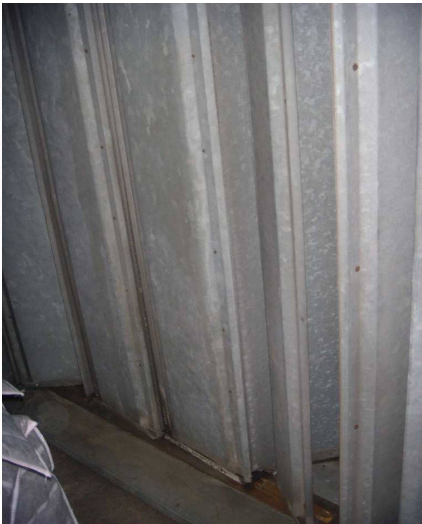
KUVA 7. Tuloilmakoneen sulkupellit eivät sulkeudu kokonaan TIK 2.2.