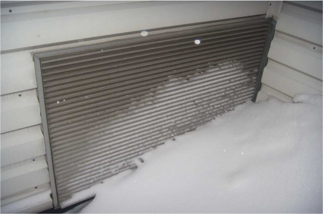
KUVA 16. Yleiskuva tuloilmakoneen raitisilmasäleiköstä.