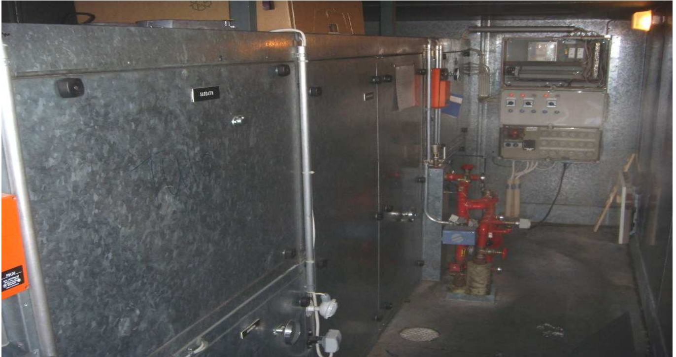
KUVA 1. Yleiskuva IV- konehuoneesta.