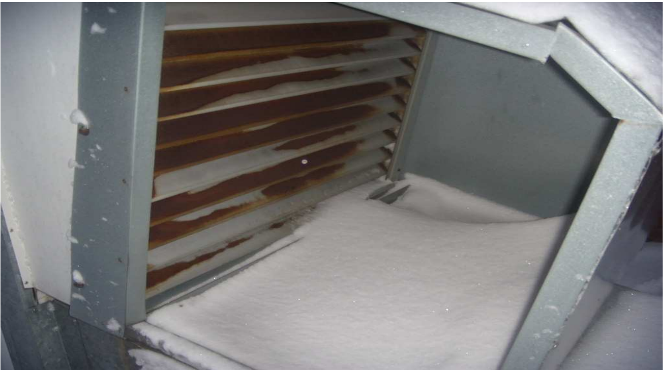
KUVA 17. Yleiskuva tuloilmakoneen raitisilmasäleiköstä.