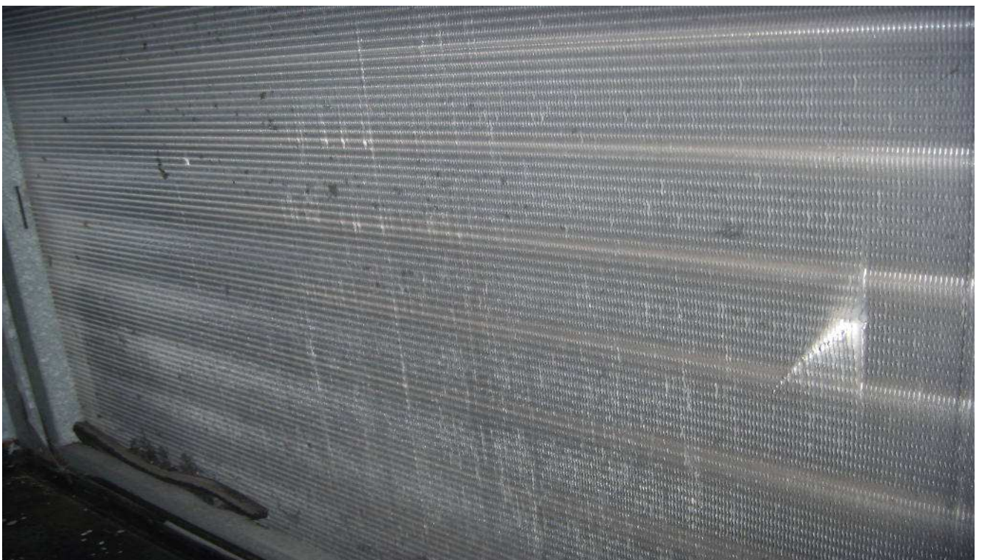
KUVA 13. Yleiskuva lämpöpatterista (TIK 4.1).