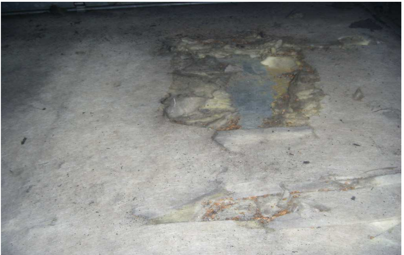
KUVA 9. Yleiskuva tuloilmakoneen kammiosta.