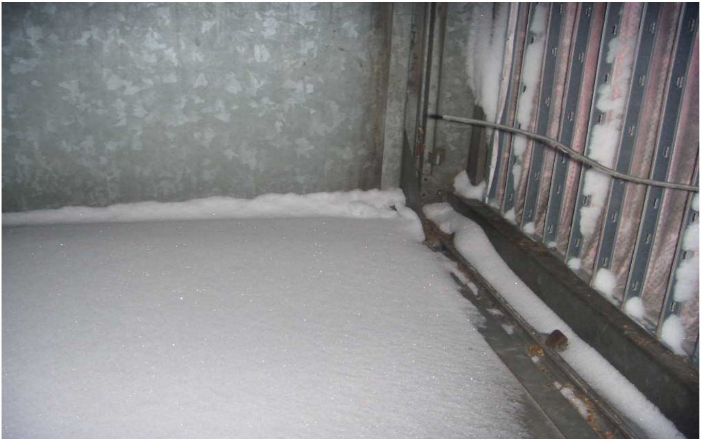
KUVA 3. Yleiskuva tuloilmasuodattimista (TIK 1.1).