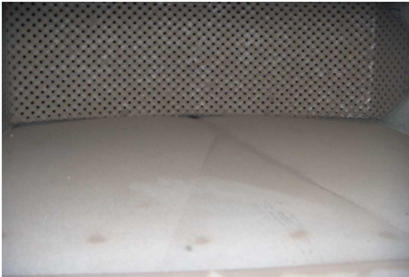
KUVA 20. Yleiskuva poistoilmakanavasta.