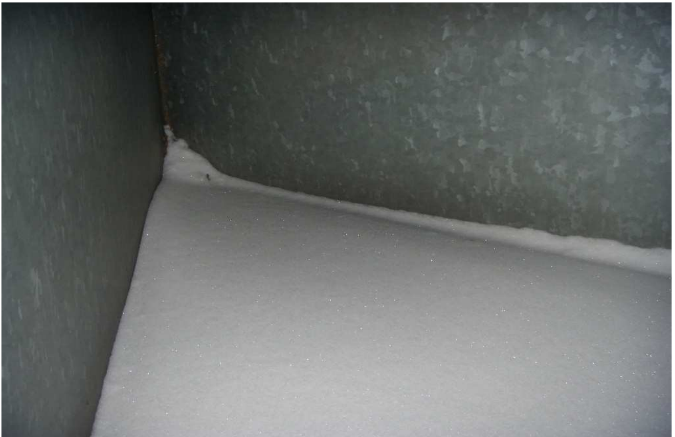
KUVA 2. Yleiskuva tuloilmakoneen raitisilmakammioista.