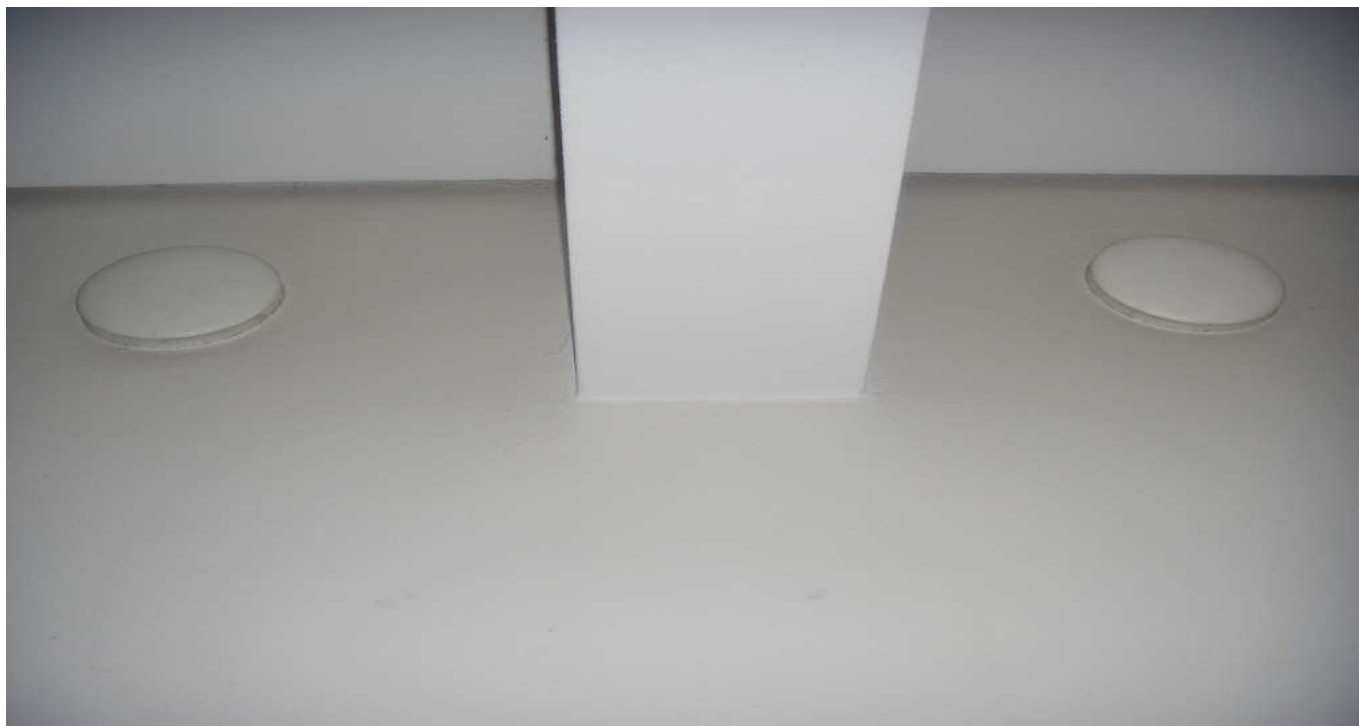
KUVA 21. Yleiskuva poistoilmaventtiileistä.